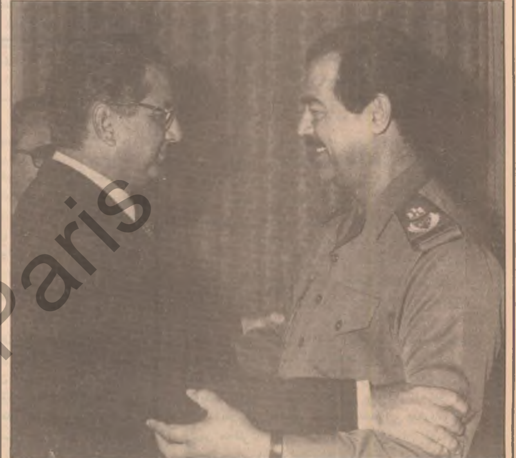
سه ره کی به ریز نامه یه کی له سه ره ک کاسترو ووه پی ده گات به ریز سه ره ک صدام حسین پیشوازی دکتور کامبرسی ئه ندانی لیژنه ی مرکز ی حزبی کو مونیستی کوبای کرد . دکتور کامبرس نامه یه کی بۆ به ریز سه ره ک صدام حسین له سه ره کی کوباه دکتور فینل کاسترو سه ه وه پیگه یانده نامه که سه باره ته په یه ونده ی دوو قۆلی نیبون به ریز سکر تیری سه ره ک کۆمار له چاویگه وته که دا نامه ده بوو .

زبانکی زۆری بیکه باندن ههروه ها ده سه ته به کی دوژمن له به ری فه یله قسی سه یه م له رۆژه لاتسی به سه که هه لوئی نربک بوونه وه ی به ره کانی پشه و ه ی ئیجه ی دا له م ناوچه یه دا جه نگاره دلیره کانمان زۆربان لئ کوشتنو نه وه ی توانی و فریای هه لاتن کهوت رای کرد .