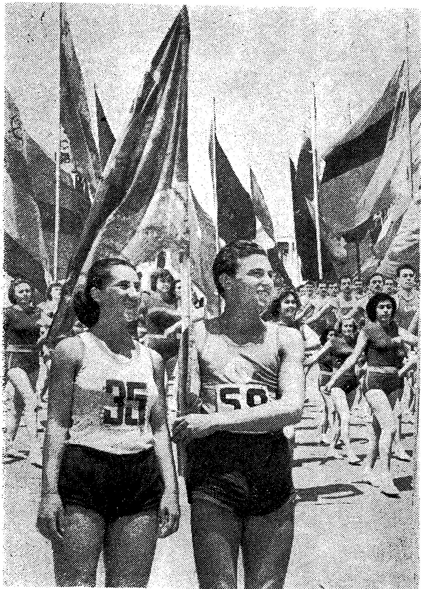
Фотоплакат, йа В. Севойан