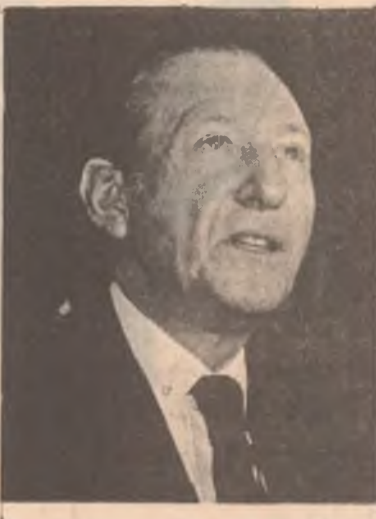
حیلمی عملی شریف

ئه م مانگه دا هه لپاردنه کی تیاکرا ، کورت فالد هایم - ی به ناسانی گه بانده کوشکی سهره ک کوماری نه ماسا ئه م کارو نه جانه زایونیه سته کانی دوو چاری سهر سورمان و ناومیته یه کی گهره کرد تا کار گه بشته ئه و راده یه ی وه زبیری ده ولته یی ئیسرائیل موشی ئیرینز چه سه ساو و میاندانه باسی ئه جمانی ئه م هه لپاردنه ی ولاتی نه ماسا بکات . زایونیه سته کان و هاوکارو هاوچی ئه مریکایه کانیان که هه میسه خویان به سهره تکانی شارستانتیتی و دیموکراتی به توه هه لته کیشنه و تانه له عهره ب ئه دن که بروایان به م دوو سهره تابه ی ئه م چهره خه نی به ، خویان به پیتجه وانه ی هه ر دوو سهره تاهو بچ شرمانه به پروپاگنده ی به رتیل دان هه ولگیان دا ده ست بگه نه کاروباری ناوخوی گه لی نه ماسا وه ( ووه کتیکتی ) یکی تر له نه ماسا دا دزی کورت فالد هایم دروست بگه ن !