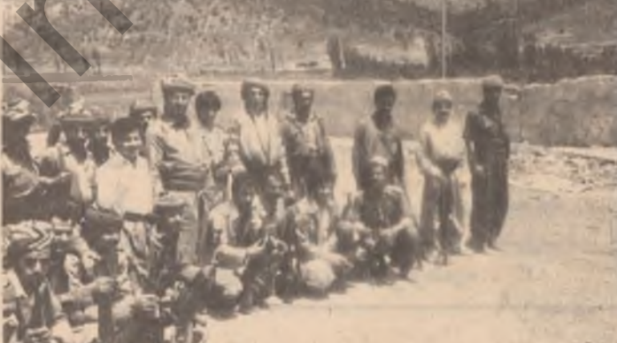
کاتیا سه روکی بهر که فته

کاتیا سه روکی بهر که فته صدام حسین ی خودی بیاریت . . . شه رکه ر شوکت عابد مزوری جیکرێ مستشارێ کوت : مه چکه هه لکرت روژا مه دینی دوژمنداری سهر وه لاتی مه دا هات و نه م د ناماده یه بو خو گوری کرێ ئیخا مه ژ دهستی دوژمنی خوی خوار لژوریا وه لاتی و دبار بو میترخاسیا وان ده شه ری دا لکه ل له سهره کی مه یی قاره مان و دبار بو سهر بازیت وه فادار بو سهره روکی تیکوشه ر صدام حسین ی خودی بیاریت . . . پاشی هه فال احمد علی پیناوی بهر بیاریت ریک خرا ووا فه رجا 68 ، با پارتا به عسا عه ره ییا هه فیشک و