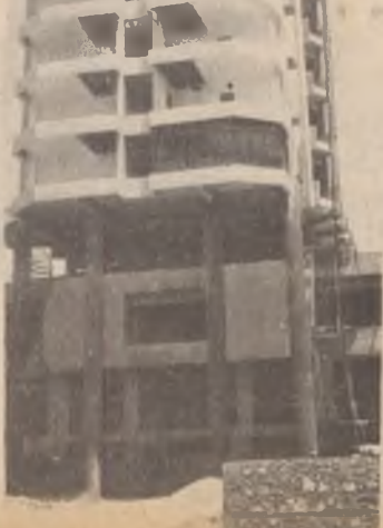
پ ئه ری ده وری کار به

پ ئه ری ده وری کار به دهست و په رسیاریت پروژکی چه د سهره کی مه یی پروژکی . . . به برابته یی کار به دهست و په رسیاریت پروژکی هه میا بشکدار یی با کری ده سهره کی مه یی پروژکی لکه ل له سهره کی مه یی لکه ل له سهره کی مه یی قارمان و هه میا پینش کینیا