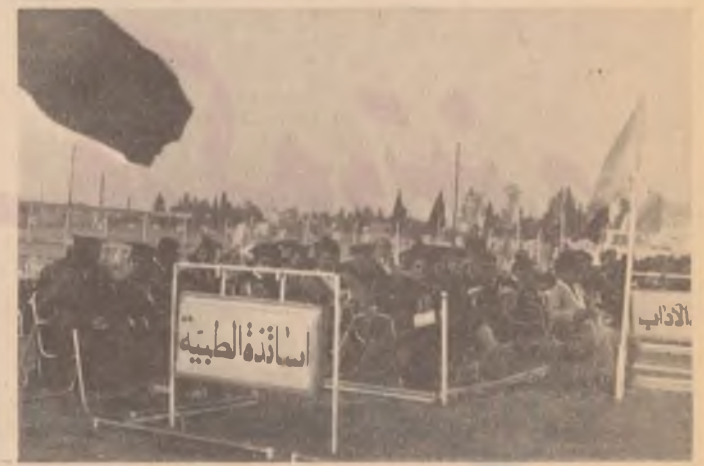
شیرزاد - لقی ههولێر

وا ئەمساڵیش بەشێکی نوێی فووتابانی زانکۆی صلاح الدین زانکۆیان بەجێ هێشت بۆ ئەوەی بنوانن پۆلی پووناکی خۆیان لە بنیات نانو و پێشکەوتندا ببینن . . .