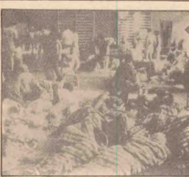
نهو لافاره زبانتیکی گهردی به ناوچه نه که بانو زوربه ی خاوی گهشت که ره کانی ناوچه گه ویرانکرده .

وه له بهر نه وهی نهو جوره رووداوانه بویتنی به برسپارو وه لامو لیکولینه وه هه به بو نه وهی به رده له روژی شته نادبارو شاروه کان لایدیوتو بزانتیت هوی خو پشاندا نه که چه !! لیتیرسراوی پاسدارانی خومه نی خوی بهم نه که هه لسا وه به نه نیی شارو به ته وه . . بو به بانی روژی دووه خه لکی شار یاسی مه له که بان ده کرد ، کردبانه نوکتو گالته جاری . . !! دهه کهوت کابرای کارگیتی و نویتنه ری خومه نی ماله که بان کردبووه مه بخسانه و مه لبه ندی خرا به کاری . . تا به بانی ، بهلام نهوانی تر واته پاسداران هه ندیکان سه خوشو نهوانی تریش به رابواردن و کوته شوینی لافره تانه وه خه ریک کردبوون . . !! تا نهو ساته خه لکی شاره که یاسی پور ده کونو پوریش هیتسا له نه خوشخانه که چیتزی نازار دهیتش . . !!