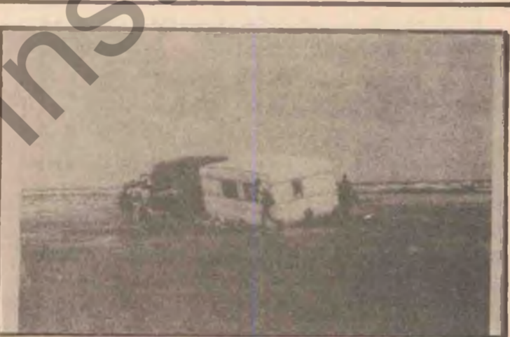
رووداره تان به وینه

کاره ساتی لافاره که ی روخی رووباری داین هه تته ی رابوردو ناویه ی گهشتو کوزاری روخی رووباری داین له فهره نسا که ره به سه ره شه بزیکی توندی لافا که بهر زایی گه شته هه شت مه تر و به درژیایی ۴۰ کیلومتر .