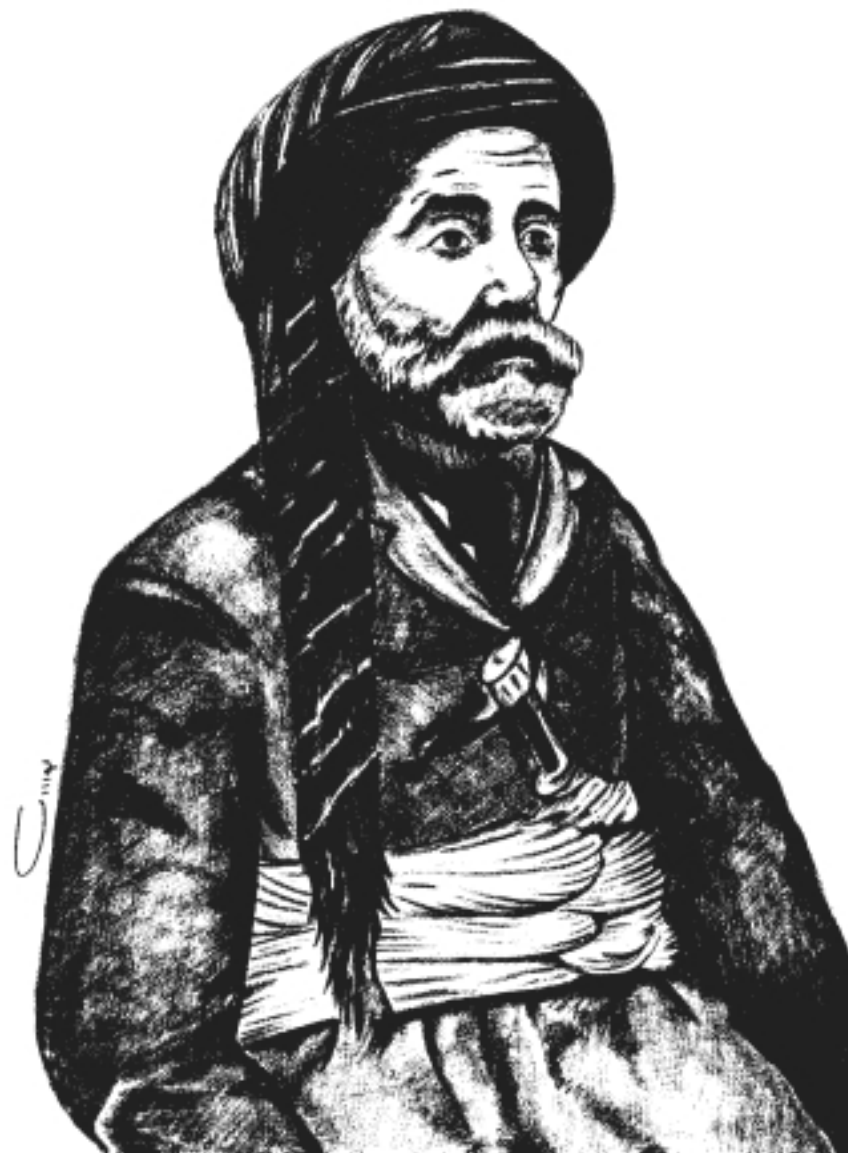
حاجى تۇنىقى پىردەپىرە