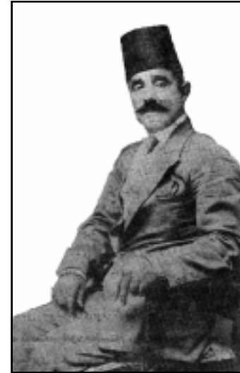
وینه ی پیره میترد له ته مه نی لاویدا له تورکیا

نه گه رچی له پیش پیره میترددا، له رۆژنامه ی تینگه یشتنی راستیدا سالی ۱۹۱۸ و له کتییی (ئه نجومه نی نه دیبانی کورد) ی ئەمەین فەزیدا بە کورتی هه ولێک بۆ به راوردکردنی شیعی کوردی و شیعی تورکی و فارسی دراوه به لام وه ک پیره میترد به ئاشکرا و ناوهینانی و ده ستنیشانکردنی دیاری