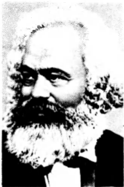
KARL MARX (1818-1883)

Lê bûrjûwazî tenê çekên ku ewê wê bikujin çê nekir: wê wisa jî mirovên ku ewê van çekan bikarbinin afirand - karkerên nûjen, proleter.