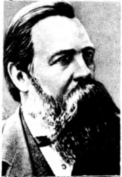
F. ENGELS (1820-1895)

Mako, bi geşbûnîya sanayîyê ve, proletarya tenê di hejmarê de zêde nabe; ew di girseyên (kîtle) girîngtir de digihîje ser hev; xurtahîya wê zêde dibe û ew pê çêtir dihise. Kêrha û hoyên (şertan) jiyane dinav proleteriyayê de berebere wekhev dibin hingî ku