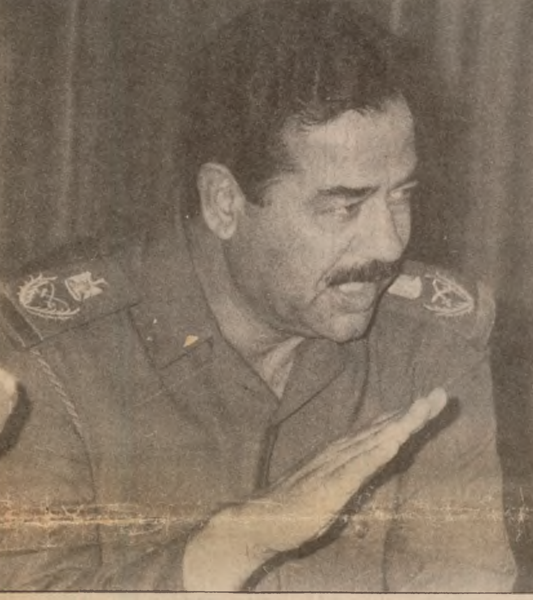
پیکه یان فرۆکه وانی تایه تیه