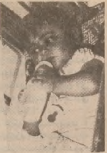
يافيووني مندال و

چنه قوناغليک دا دهروات مندال کاتي تمه نسي هه سالانه هه له کولان و مال هوه فيتر ده وي بهر ورده ده س و به راي من مندال به س قوناغدا تي ده رهي . ۱ - مالو خيزان که دايک و باوک ت تمه نيکي دووو دريژ هه ده يت ديس له من هه ل نه گرو ناکداري زيانو بهر ورده کردنيان بن تمناعت له زباني تايه تي : شدا پوه ي که خاوه ني تافي کردنه سوه .