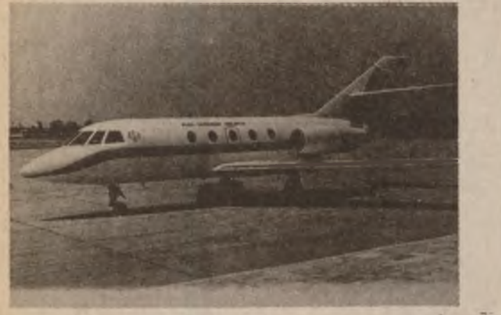
پیکه یان فرۆکه وانی تایه تیه

له راگه یان دیکه تایه تیه دا بۆ رۆژنامه ی (الثوره) نیشانی دا که سه ره کردایه کی میژوو پیمان زۆرجار ناگاداری رۆژی تاران کرده که هه تری ناسمانی ده ستی دریزه ی عیراق توانی نه وه هه یه زۆر به توندی له هه موو نه و نیشانه سه ره یی و ناووردی یان تیران دا که مه به ستی ئیتر هه چه ندیک دوور بن .