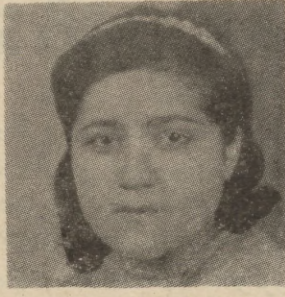
چیمهن نه محمد کاوس