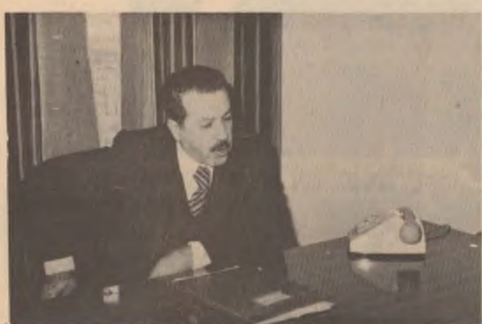
به ریز هاشم حسن موزیشیوسی ده ولت ده رباره ی چاژنه کانی ئازار ووه (هاوکاری) وای و فرمووی :