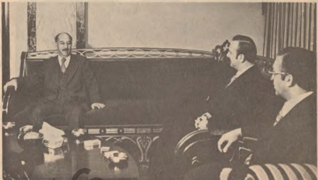
سەرۆکی فەرماندە وەرەقی بەرێز سەرۆکی فەرماندە احمد حسن البکر بەلەوێزی کۆبەرە و بەرێز سەرۆکی فەرماندە احمد حسن البکر

دوێتی سەعات دەو نیوی سەر لەبەینی بەرێز سەرۆکی فەرماندە احمد حسن البکر لە کۆشکی کۆماری و مەرقەیی پاورمنا مە یەرێز جـوان کارنیروۆ ایانیز بالۆژی کویا لە کوماری عیراکی و مەرگرت لە دابی و مەرگرتی کـوو مەرگرتی پاورمنا مەیدا دکتۆر سەدون حمادی و مـزبـری دەرەموو بەرێز شەم ابراهیم سەرۆکی دیوانی سەرۆکی مەیدا بەشدار پورە نا . د . ع .