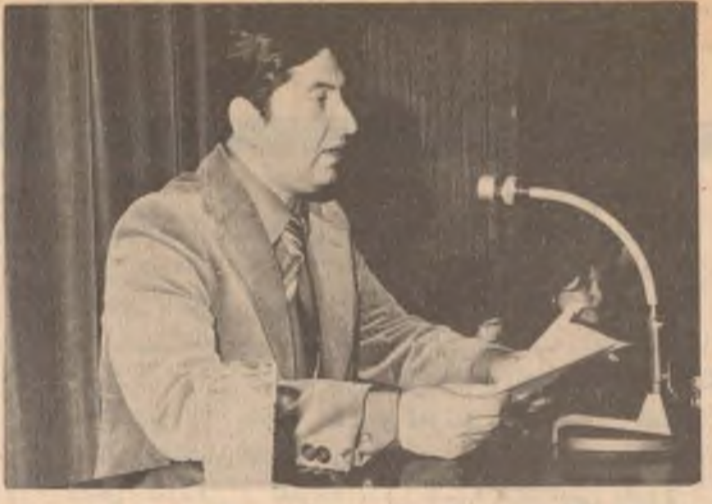
رۆژی سێ شەممە راپۆرتی بەرێز سەد قاسم حمادی وەزیری راگەیاندن ، لە چوارچۆرە گەڕاندە کەیدا بە ناوچە ئۆتۆنۆمی سەری لە بارێزگای سلێمانی داو لە لایەن بەرێزێن ارشد احمد محمد بارێزگای سلێمانی و هاوێ محمد زەمان عیالی زاق سەرکرتی سەرکردایەتی شەمی سلێمانی حزبی بەسەر عەرەبی سۆشالیست و لێ پرسیارانی دانێری راگەیاندن لە بارێزگاکەدا ، پێشوازی کرا .

● ئەوێ شایانی باسە بە یانێری هاوکاری لە سلێمانی چاوی بە وەزیری بەرێز گەوتو چەند پرسیاریکی لێکرد . ● ئەو لایەن پرسیاریکیدا دەربارە سەرکردانەکی وەزیری بەرێز بۆ بارێزگاکە وتی :