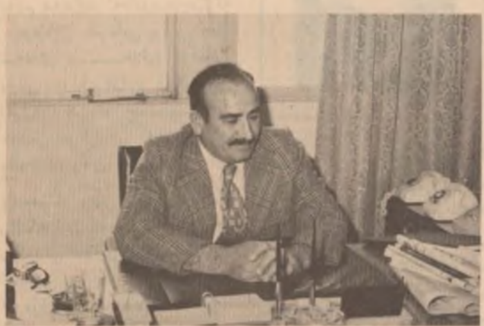
به ریز عزیز رشید موزیشیوسی ده ولت به پوتنه چاژنه کانی ئازاره ووه (هاوکاری) وای و فرمووی :

۱۱ ئازار رۆژی لسه و رووخاش بیته به دهرکردنی به یاننامه ی ۱۱ ئازار له سالی ۱۹۷۰دا