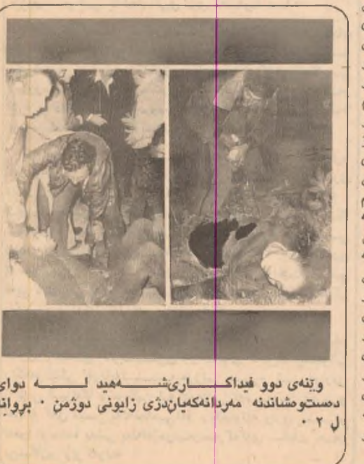
وتە دوو فیداکاری شەمەد لـمو دەستووشاندا مەردانەکیان دزی زایونی دوژمن . برۆانە

حزبی بەسەر عەرەبی سۆشالیست ، لەسەر بەنجینەیی بیرو باوەری مەزبەن-رە-و-ر-ان-و-د-ی- خۆی ، هەر لە زوێر وەگەری و گەشەتەکی کە لە ساڵانی شەستەکاندا ئێنجامی هەتوێتی نامرۆفانەیی حکومەت دیکتاتۆری کۆتەبەرستەکانی دواي شۆرش- تەممووزی ۱۹۵۸ رۆژ لە دواي رۆژی رۆی لە ئالۆژی دەکرد ، هەر لە زوێر و رۆی لـمو-کـر-د-ک-ە-چا-ر-ە-س-ەر-ی- یانەیی بۆ مەسەلەکی دەسپێش-ب-کات-و-ب-ه-ئ-ج-ا-ی- عادیلانەیی بکەین . ئەوێ وێر-ب-و-ی-ز-ب-ل-ک-ۆ-ر-ە- ساڵی (۱۹۶۴) بەنجەیی بۆ راکێشواو لە تەم- ۱۹۶۸ ییدا کە دەسەڵاتی حکومەتی ولاتی گرتە دەست ، دڵسۆزانەیی بەسەر-ب-ی-ر-و-ه-چ-و-، تەقەلادان بۆ چارەسەرکردنی هەر بەو نیازەشی ساڵی ۱۹۶۹ لە دواي بەسەر-د-ا-ی-م-اف-ە-ر-ۆ-ش-ی- نەتەوێی کوردمان ئانی جێگیرکردو بە- سەماندن . ئێجا لە (۱۱) ی ئازاری (۱۹۷۰) دا ، لـمو نێوانی بەیاننامە ئازادەو-ب-ی-اری مافی ئۆتۆنۆمی بۆ گەل کوردمان داو لە (۱۱) ی ئازاری ساڵی (۱۹۷۴) ییدا بریاوی شتواری یاسایی بۆ دامەزراندو دەزگاکانی بەوێ بۆ یەکەجار لـمو-م-ز-و-ی-گ-ە-ل-ن-ا-و-ل-س-ەر- دەستی شۆرش (۱۷) ی تەممووزی پێشکەوتن- سەرکردایەتی سیاسی-ب-ه-ش-ۆ-ر-ش-ک-ە-ی-د-ا-ب-ه- ر-و-ای-ن-ت-ە-و-ی-ب-ه-ش-ۆ-ر-ش-ک-ە-ی-د-ا-ب-ه- لە چوار ساڵی پێشواو-ت-ا-ق-ی-ر-د-ن-ە-و-ی- ناوچە کوردستان ، ئێنجامی-ب-ا-ی-ه-ب-ت-د-ان- سەرکردایەتی حیزب-و-ش-ۆ-ر-ش-ک-ە-ی- سەرچەم چارەسەر-ی-گ-ە-ل-ی-ع-ز-ا-ق-ان-ب-ه- کەمبەختی-ب-ک-ا-ن-ی-ه-و-ب-ت-گ-ر-ت-ی-م-م-و-ه- پێشکەوتن-و-ز-ا-ه-ک-ان-ل-م-ا-ر-و-ی- جیهاندا ، لە رۆی ئێ- کۆتەبەرستان و ئێ- راگرتو چەس- چالاکییە کەوتە کاروباری ناوچە- رەوێرەو ، بۆتە خەلکی کوردستان بۆتە نیشانی مایه- زایبۆنێمی دوژمن . سلاو لە بـی- چوارەمی دەرچوونی یاسای ئۆتۆنۆمی ناوچە- کوردستان .