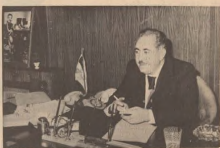
به ریز بکر رسول محمود، موزیشیوسی کاروباری کومه لایهتی، به پوتنه چاژنه کانی ئازار ووه (هاوکاری) وای و فرمووی :