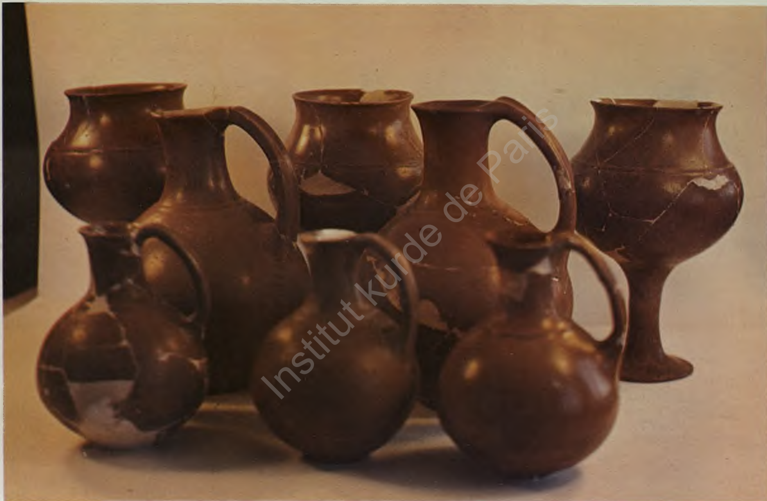
Fig. 8 : Characteristic Urartian pottery found in the excavations at Çavuştepe