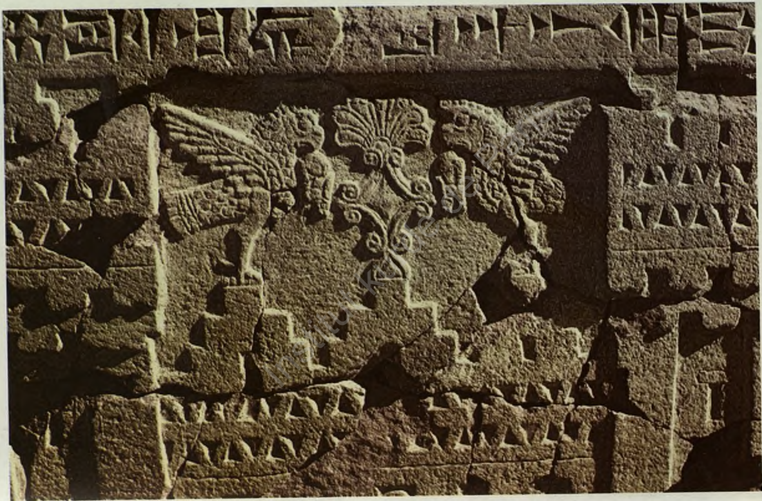
Fig. 12 : Detail from the incised and decorated stone pillars found at Adilcevaz excavations