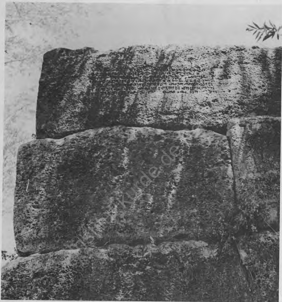
Fig. 3 : The foundation inscription at the Sardur-buttres (Madırburç)