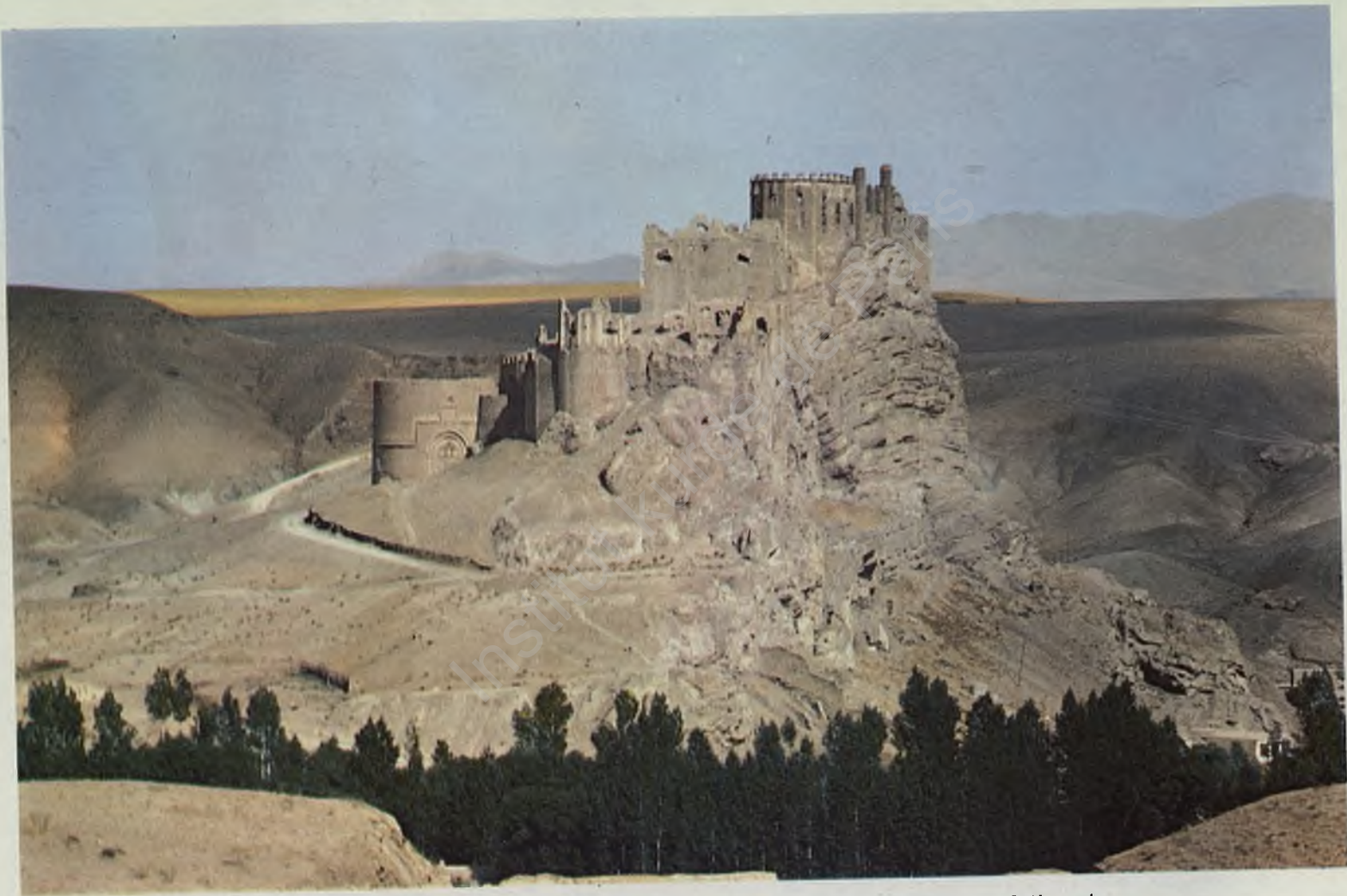
Fig. 14: The monumental castle of Hoşap, built on the Urartian foundations in the Ottoman period