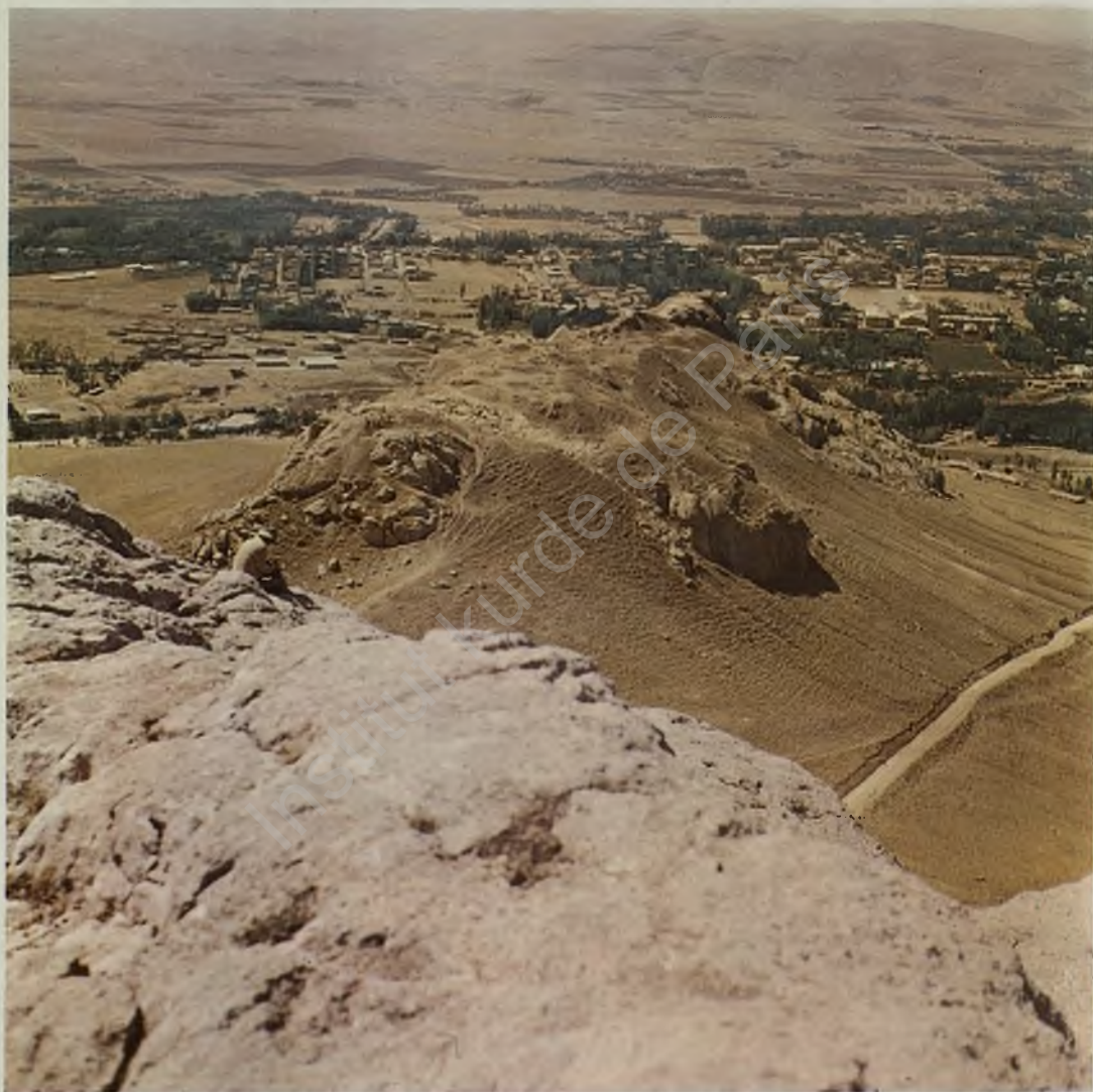
Fig. 10: The Urartian capital Toprakkale and the general view of the modern Van seen from the Zimzim Mountain