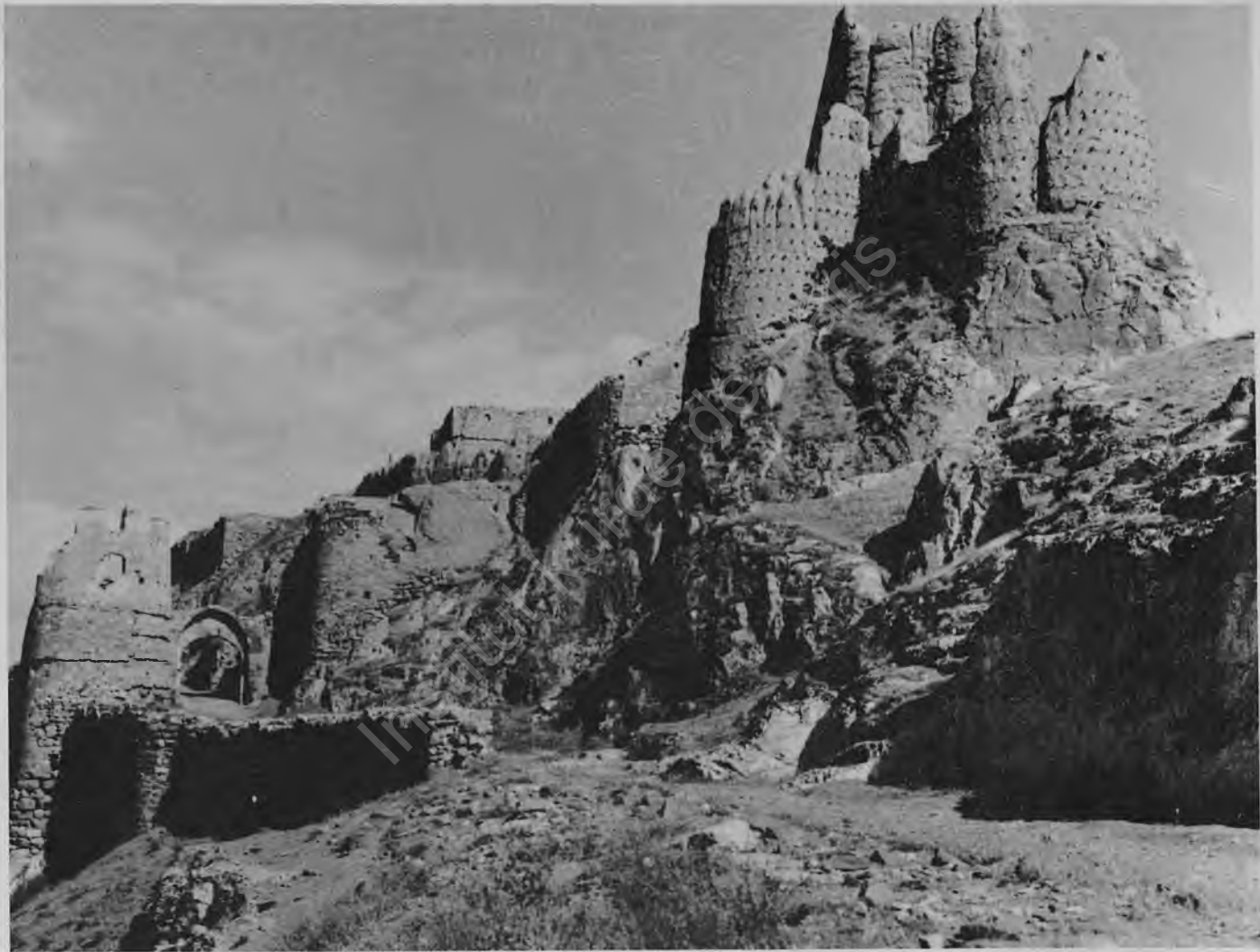
Fig. 5: The way climbing up to the Van Castle and Castle-gate of the Turkish period