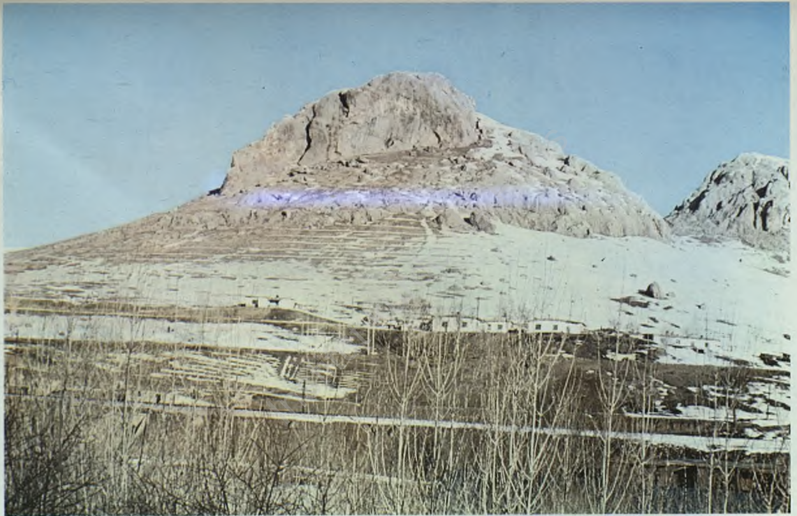
Fig. 9 : Winter scene from Toprakkale, the last capital of Urartu