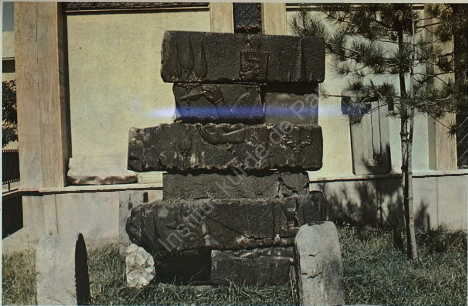
Fig. 11 : The magnificent rock relief of Adilcevaz; the Urartian stormgod Teiseba on a bull