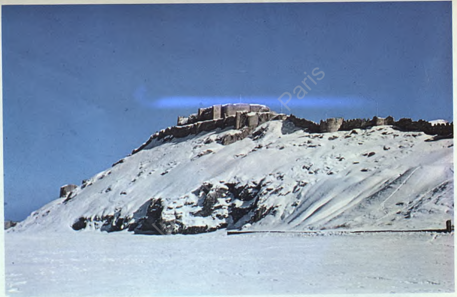
Fig. 2 : Winter scene from Tushpa; northern view