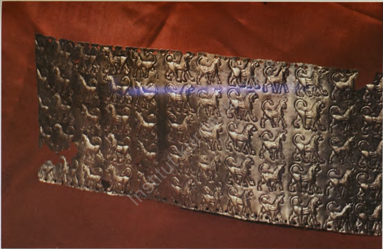
Fig. 13: An example of the Urartian metal workmanship: figures of lions and bulls on a bronze belt