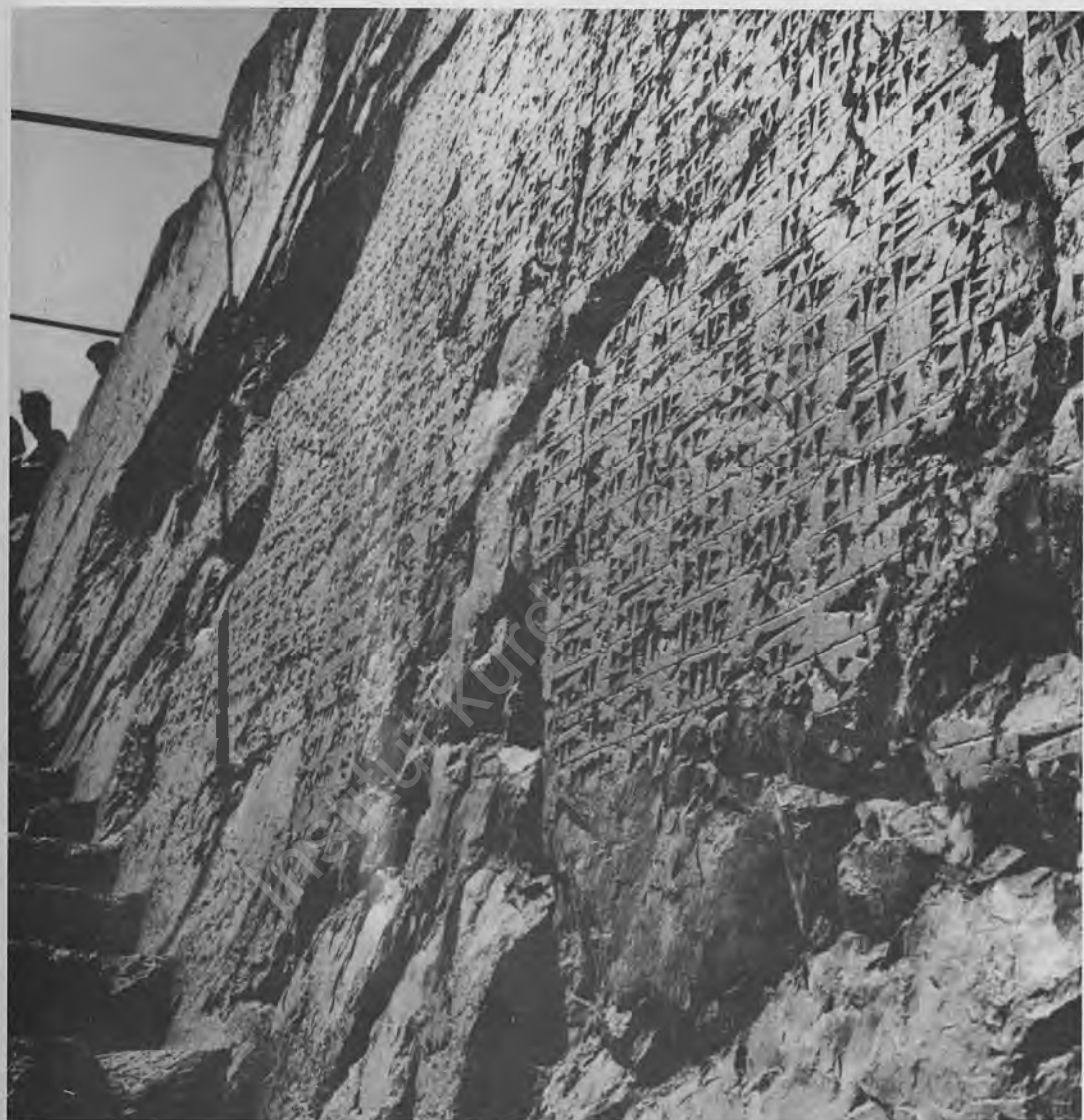
Fig. 4: The chamber-tomb of Argishti and his inscription