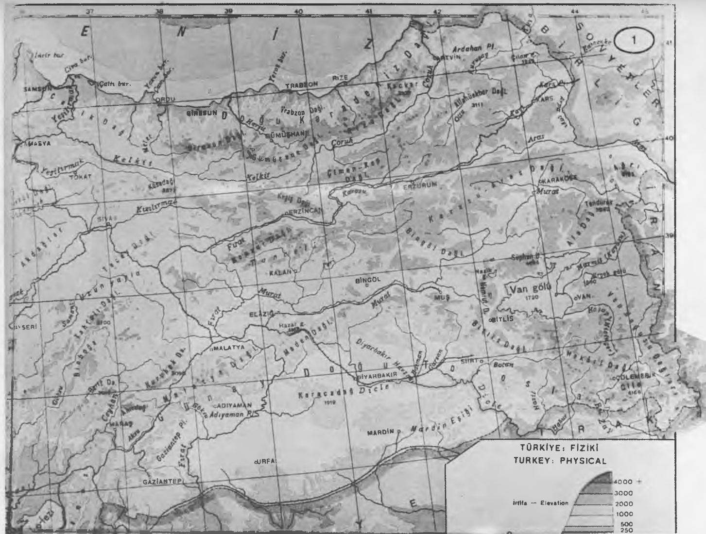
Map I: Physical map of Eastern Anatolia