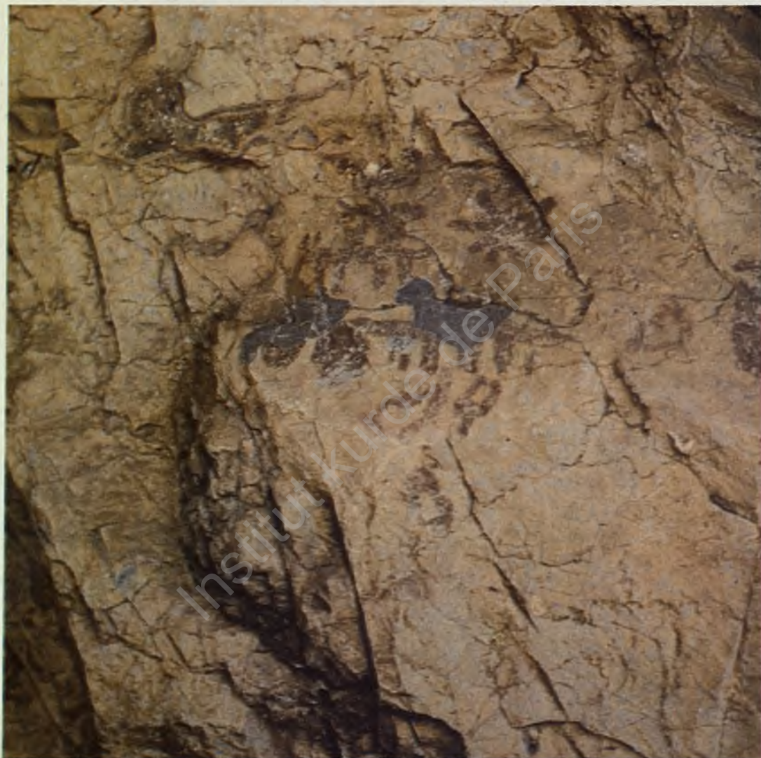
Fig. 1 : Rock painting showing a goddess on a bull in the Maiden's Cave at the village of Yedisakım, Van (15000-8000 B.C.)