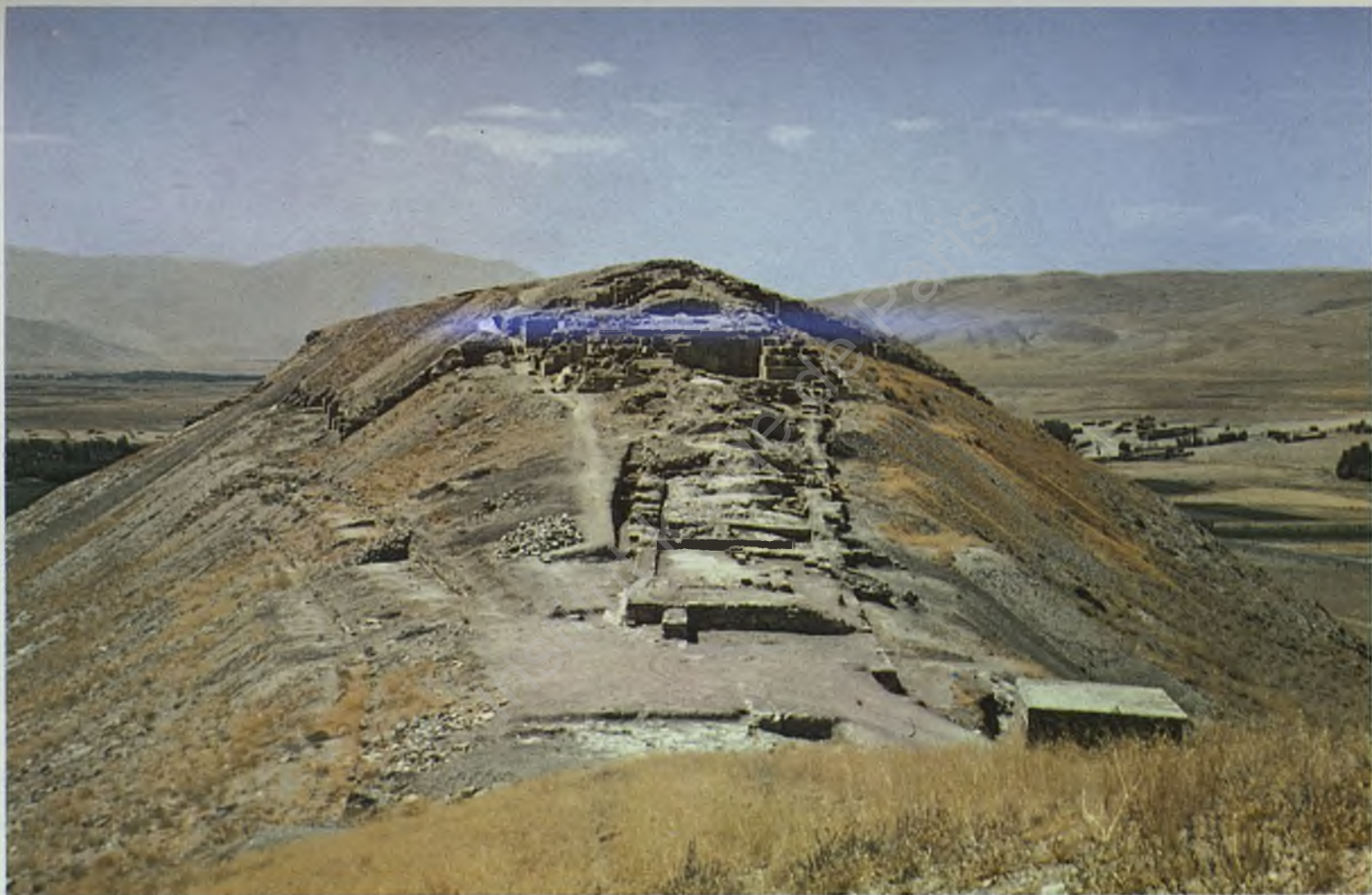
Fig. 7 : Çavuştepe seen from the «Uper Castle»