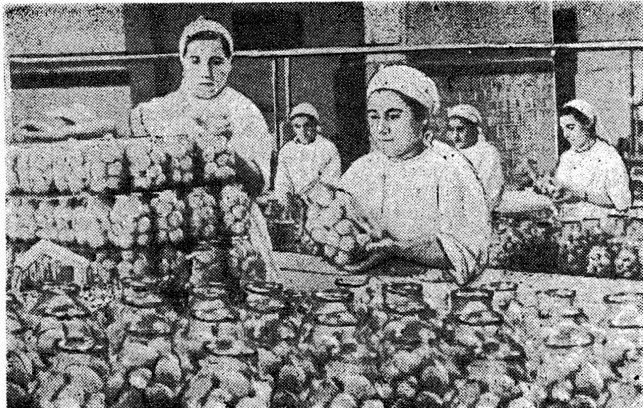
Ль заводә Еревәнейә консервәе

Шөхлә һәкьн бәрәвкьрһнедә к'омәкә мөзһн һәкьн бьдһн Словәкиәе СМТ-ед мәрзәд чехие, к'ә һәкьн дьрун һәкьн дәрәңг дәстпедбә, әв һ'әму мәшәлә дьдә сәлә һәкьн ль Словәкиәе бәрәвкьн һәкьн дө шәра зедә мөзһилчәндһнә, һәкьн сәлә 1954-ә. (ТАСС).