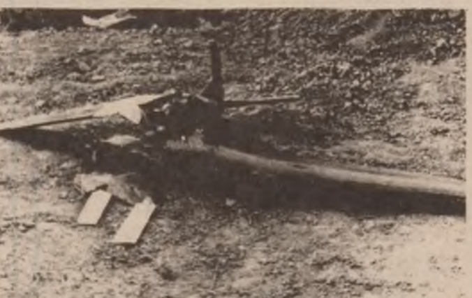
وینسه ی ئه و فرۆکه (استطلاع) هی دوژمنی ده ستدریژی گه ر وستی بیتته ناوسنور له که رتی فه یله ی حوتی پالموان خرایه خواروه .

ریکخراوی موجهیدینی خه لکی ئیران وئی ، فرۆکه کانی رژیمی ئیران بۆردومانی ئه و دیتها ته نازاد کراوانه ی کرد که له باکووری ئیران له ناوچه ی کاهرزادا هه زه کانی ریکخراوه که نازادبان کردوه . ریکخراوه که له به یاننامه به کدا که بیژئ له له نه دن دا به نی کرد وئی ، دوا ی نه وه هه زه کانی ئیران نه یاتوانی رووبه رووی هه زه کانی ریکخراو بوه ستن به فرۆکه ی فانتۆم که وتنه بۆردومان کردنی ئه و دیتها ته وه ئه مه ش بووه هه زوی کوشتنو برینه دار کردنی ژماره به که له دانیشتوانی ئه و دیتها تانه .