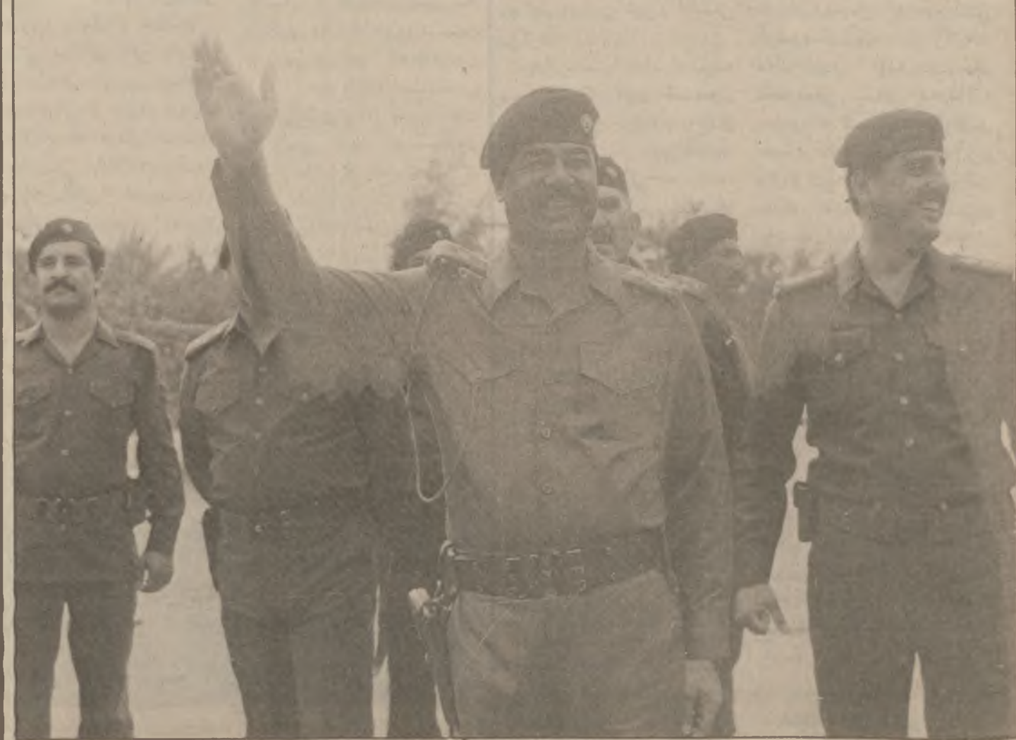
به ریز سه ره ک موه ی سوپا وکن صدام حسین فه رمانده ی گشتی هیزه چه کداره کان ، پتیری نیوه رۆ ، پیتشه وانی پاله وانه عیراقیه مه زنه کانی باسه وانی کوماری و هیزه ی تایبه تی کرد ، که به ئالای سه ره کوه وتنه وه له لوتکسه سه ره بزه کانی چیاکانی پینجویین وه گه رانه وه . نهم پیتشه وانه فریق ره شسی عیراقی گه یه شسته ی هیزه چه کداره کان و نه وری به رگری و فریق روکتی به گه م عیدالجبار شتشل سه ره کی ئه رکانی سوپا و جه ماوه یه کی ژۆر له هاوولایه کان که نه مه ره و نه و به ری نه وه شه قاهه یان کر تپوو که پاله وانه کان پیا رته ت بوون به شداریا ن کرد .

به یاننامه ی ژماره ۱۲۶۸ سهر کردایه تی گشتی هیزه چه کداره کان مژده ی نه وه ی دا که چهنگاوه ره مه رده کانی سوپای دلیرمان تونی سه ی به لاماریکی تری ناره وای دوزمن له ناچه ی پینجویین وه به شیکه ی و به هه لسه تیکی پینجوه رانه ی مهردانه ی هیزه به لاماره ده ره کانی دوزمن ته فرو تونا کراو له و رۆژه دا هیزی ئاسمانی ئازامان دهرۆیکی مهردانه ی گیرا له ته فرو تونا کردنی هیزه کانی دوزمندا فرۆکه کانمان ۲۰۶ هه لسه تی شترانه یان کرده سه ر بنگه کانی دوزمن له وانه ی له به لاماره کدا به شداربون و بۆ سه ر بنگه کانیا ن له قولابی خاکی ئیرانو زبانی سه رو مالی گه وریان به ی گه یه نرا . به یاننامه ی ژماره ۱۲۶۹ رای گه یاند که نهجمی