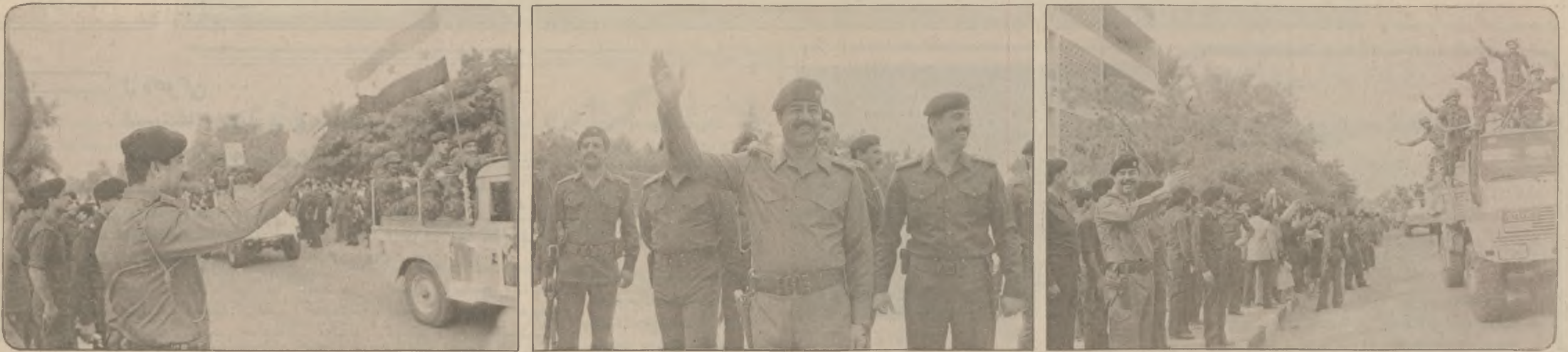
سەرەکی فەرماندە صدام حسین پێشوازی ئەو پالەوانە عێراقییە مەردانە دەکات بە ئالای سەرکەوتنەو گەڕانەو