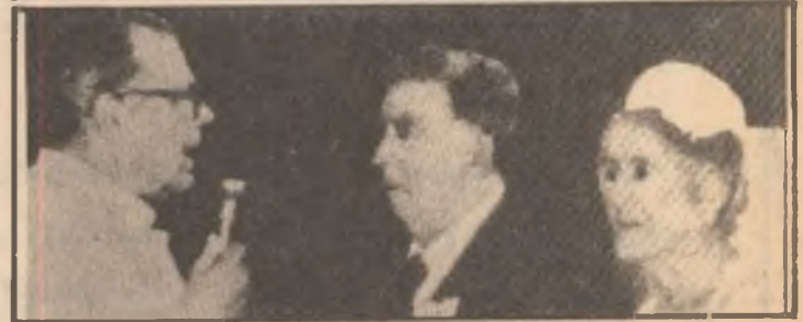
۱۹۱۹ خۆشويستوه ۱۹۸۰ خواستى [۱]

ماریا نیما سولیسو بھوئیموھو چونکە بووم بە ئوسکار ھورنازیال لە سالی ۱۹۱۹دا ھەزبان لەبەک کردوھ ... بەلام چارەنووس وای ... ھەرھەتە ئۆسکار ئۆتۆمۆبیلێکی تری ھیتا ، بەلام ماریا سوئیدی پیرناچیتتەرە کە رۆژتیکى ھەتار بوو سالی ۱۹۱۹ ، لە دلی خۆی بھخۆشویستوھ ، ئوسکاری ھەر خۆشویستوھ ، ھەرچەندە بەکۆنیشیان لە چارە نەنووسراپیت ، ھەرھەتە سوئیدی خۆرد کە روو بەلای ھیچ بیابۆیکدا تەمەنی مێردمەندالی لێ تۆتایخانەدا ... بەخۆم وت نەکات بەو مەرامە ... ماریا ئەلیت ھەر چرکە یەک لە ۶۴ سالی تێپەری بەنرخە لەلام چونکە بە پاشماوێ زبانی مانگی سالی ۱۹۲۰دا ، بەلام چەرخى ھەنگوینە ، ئیستا ئەتوانم چارەنووس بەبێجھوانی