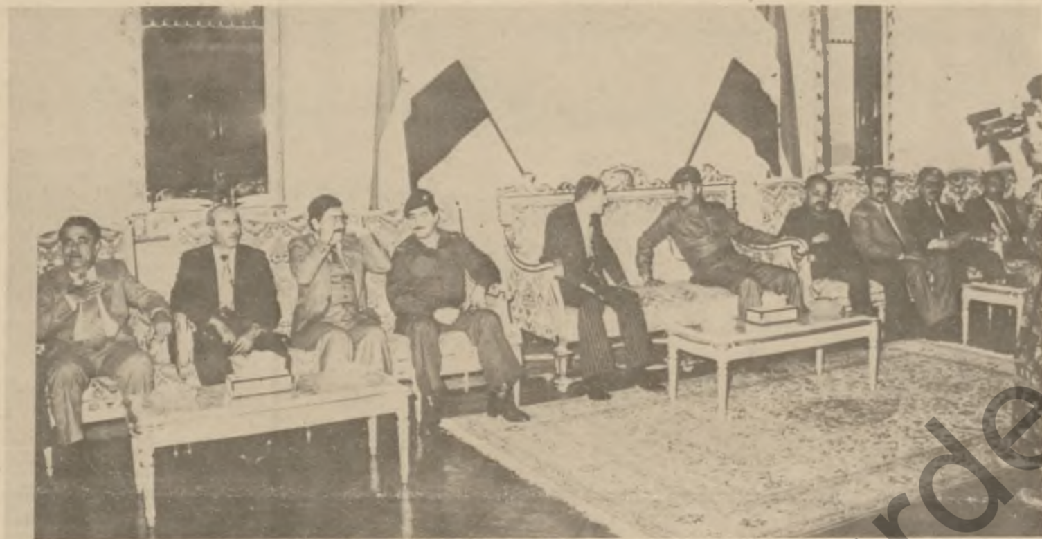
سەرۆکی فرماندە میدالیای ئازایەتی بە ئێرێ سەرۆکی فرماندە میدالیای ئازایەتی بە ئێرێ

سەرۆکی فرماندە بە شەڕێ جەڤێ نەورۆزێ رەگەن و دوو یانێ رەگەن و: