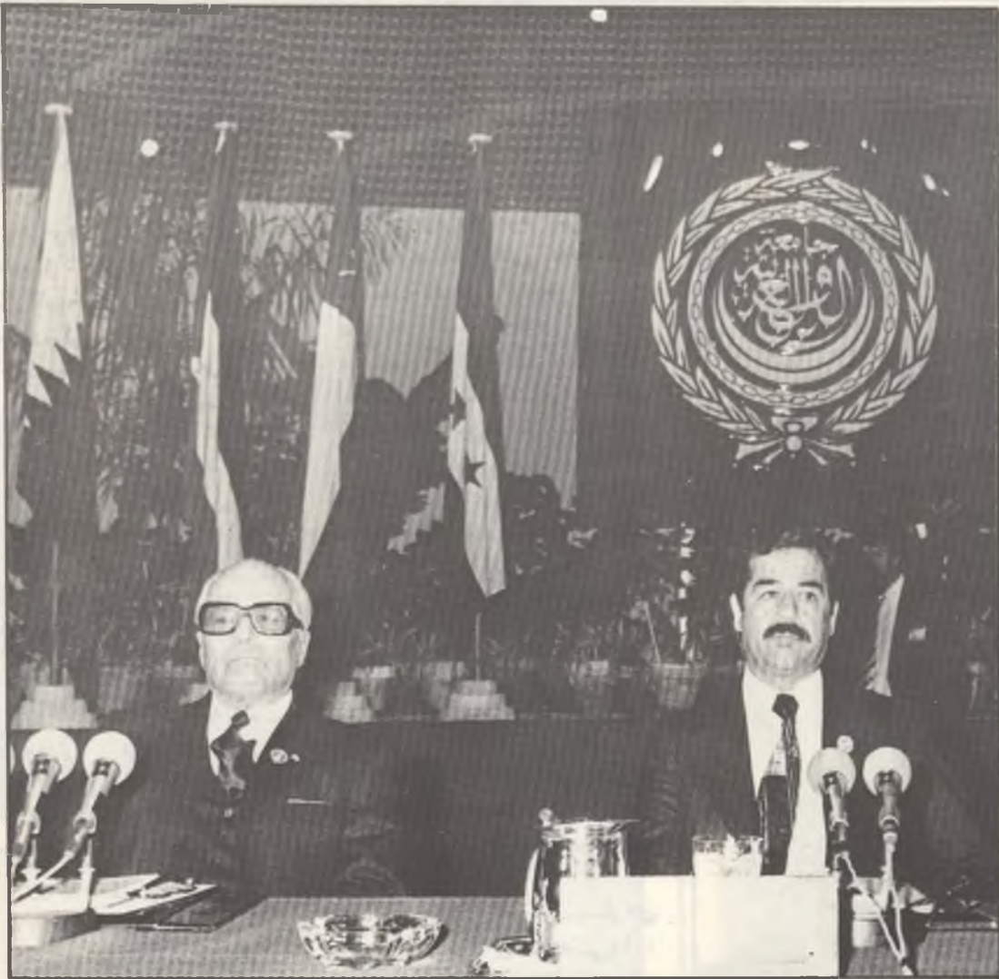
لسانہ بیسره و مری سیازدهه مین سالسه بهر بابوونی شورشى حقهه سى تموزدا

وا شورشى مەزەنەسى حەقەدى سى تەموز لاسە عیراقى خۆشەو سەستوم مەزەندا پى نایسە جواردهه مین سالسه تەمەنەو بە درێزایسە تەمەنى سیازدهه سالهى خۆى ئەوهى چەسپاند گە شورشىكى مەزەنەو گەورەبەو لە ماوهى سیازدهه ساله تەمەنى دا ئەوهى سەماند گە شورشى ئەزگە دژوارو مەزەنەکانە ، شورشى رێگای تاپەتى و سەرەخۆبە چونگە لە کردارى ناوخۆسى و پرەوى نەتەسەو سەو سیاسەتى نێو دەولەتى دا ، لە هەموو چوارچێوە کەسان تەبەرێوه گە لە ژێر سایهى گەبەرەو سەو هەتە دەولەتى ئەکاندا رێبان پى دەدریت .