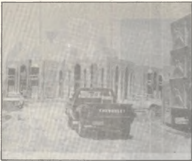
۸ - عيادهي تهئمني تهندروستی ۲۲۰ ۹ - مهلبنده تهندروستی به کانی گونده