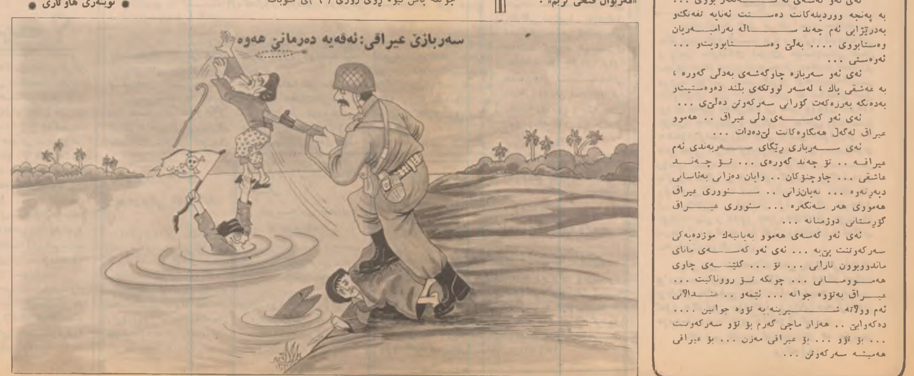
سهرپازی عیرافی: نه فیه دهرمانی هوه