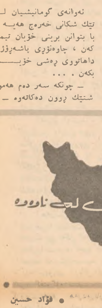
ئيران له خاوه

ده کن با به کرده خونه چه به له کابیان به جی بکهن... چونکه نه وان له نیتمه زیاتر شاره زای لندان و زه برو زهنگی عراق... وه چؤن عراق له کات و شوتی خزی بریاری خزی به جی... ده که به یی، که لاتی نیران نه و راستی به دوزان، که کاتن عراق بریاری دا ج به جی بیلانیک بکات چونی به جی ده که به یی... وه نه وانیش دوزان که عراق چسؤن وه لای کرده وه ناپه سی... نده کابیان ده داته وه... شیتک نی به له بهر دم عراقی کابگیر یخسوات، به لام عراق به گوژی هری بیتتت مامنه ده کات، کانی بؤی ده رکوتی... که کاتی نه وه هاتوره خهرج... تیک شکانی که خره که یی به جی بکانه... هه وای گومانیشیان له تیک شکانی خهرج هیه، با بتوان برنی خزیان تیار کن، چه ناووزی باشه پووزی داهاووی په شی خزیان بکن... چونکه سر دم هموو شیتک پوون ده کاته وه