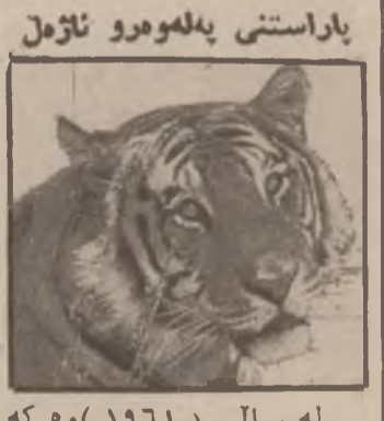
باراستنی پله وهرو نازه ل

نهمالمانیا دابون ، له باش ته و او بونی جهنگی دوهمی جهانی که نهمالمانیا خوی دا به ده ستوه ، له کاتسی بهردانی کومه دلیت کدا تیکرا به ناله می مؤسیقاوه به مؤسیقا لیدان هانتسه دهر وه . نه وهی جسیتی تیرامانه کس نازانی چؤن نه و دیلانته نه وه همرو ناله ته مؤسیقا بانه یان گه باندونه به ندیخانته فیزی مؤسیقا بوونه .