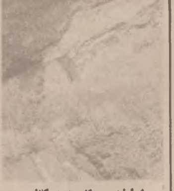
شاخه ناسینه گانسی

مؤسیقای نازادی لسه به ندیخاندا گوفاری (باری ماتس) گوفاریکی فهره نسه بیسی وتنه داره له همرو جهانداندا کاسراوه .