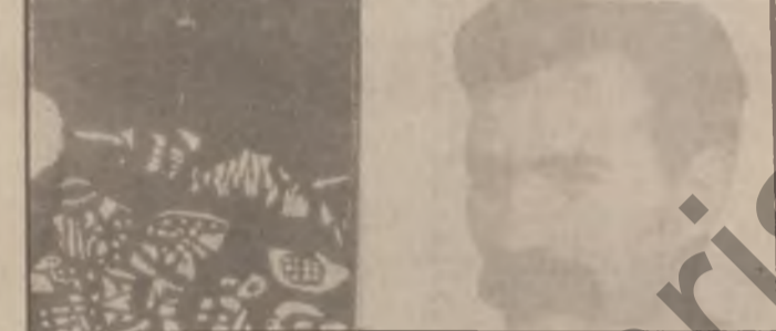
نهمالمانیا دابون ، له باش

نهمالمانیا دابون ، له باش ته و او بونی جهنگی دوهمی جهانی که نهمالمانیا خوی دا به ده ستوه ، له کاتسی بهردانی کومه دلیت کدا تیکرا به ناله می مؤسیقاوه به مؤسیقا لیدان هانتسه دهر وه . نه وهی جسیتی تیرامانه کس نازانی چؤن نه و دیلانته نه وه همرو ناله ته مؤسیقا بانه یان گه باندونه به ندیخانته فیزی مؤسیقا بوونه .