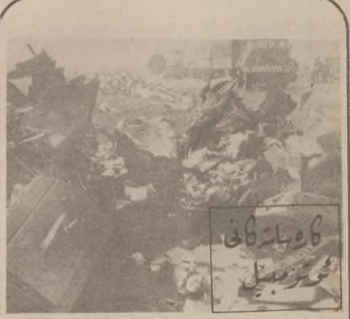
له فهرنسا ده زگانگی هاوچؤن کردن زماره کی

تهده زانی مانای تیرسون چی به ؟ هاواری کردو وتی : نهم برسیمه ده چه سهر داوه تی پشیله . . نه وانی تر هه مو هاواری ناره زایی و ناگادار کردنه یان را ده گایاند ، نامؤز گاریشیا ده کرد که : ( قسمی پشیله فیلسو تیوسته بروای پن نه کهن ، به لام چوله کی ناخرشهر به گوئی هاواریکانی نه کردو لنی داو چوه سهر داوه تی بیر پشیله ! گرمی لن کردو جگره بیکی پشیکش کرد ، به لام چوله کی جگره کی رته کرده ، چونکه جگره نازاری قورگی دده او ده بیته هؤی کوکین . . پشیله به خوشی و زمانیکی لووسه ده سستی خواری .