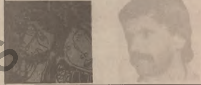
نهمالمانیا دابون ، له باش

نهمالمانیا دابون ، له باش ته و او بونی جهنگی دوهمی جهانی که نهمالمانیا خوی دا به ده ستوه ، له کاتسی بهردانی کومه دلیت کدا تیکرا به ناله می مؤسیقاوه به مؤسیقا لیدان هانتسه دهر وه . نه وهی جسیتی تیرامانه کس نازانی چؤن نه و دیلانته نه وه همرو ناله ته مؤسیقا بانه یان گه باندونه به ندیخانته فیزی مؤسیقا بوونه .