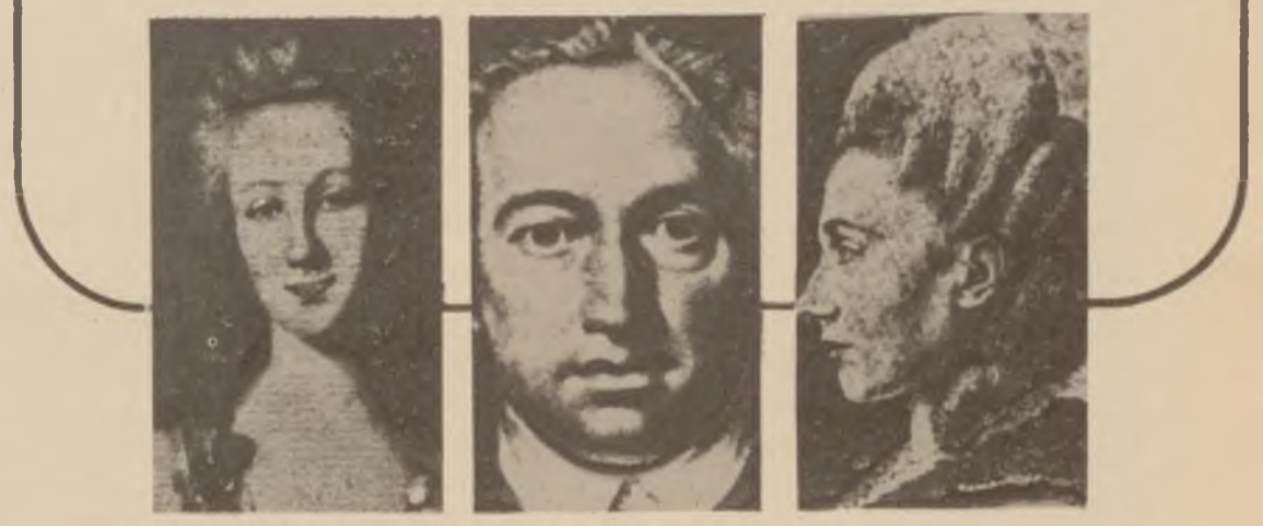
رؤخ بپه ر