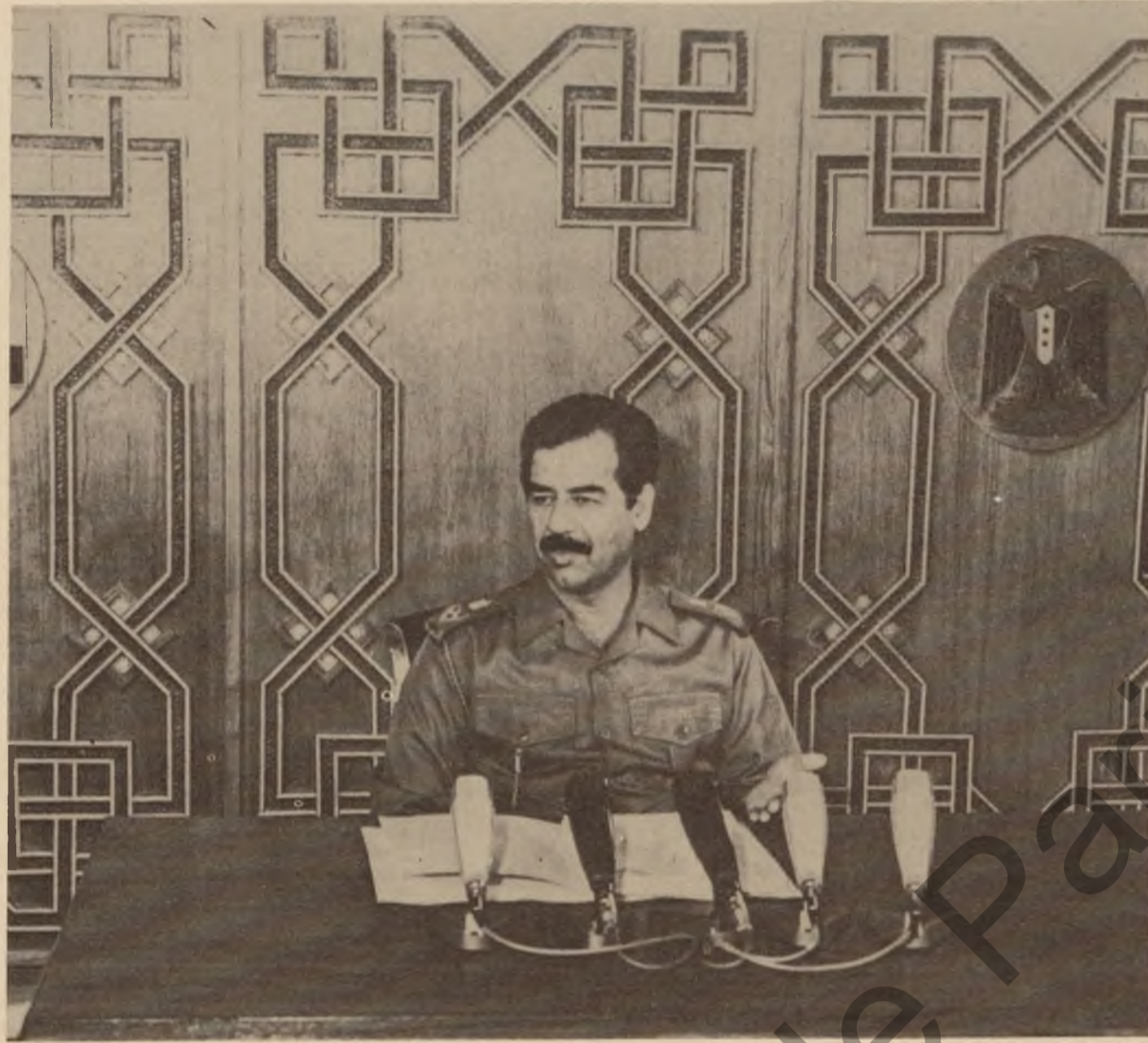
هاریکاری و په یوه ندی نئو دوه لئی شکره ندی و هاوسه ننگه .