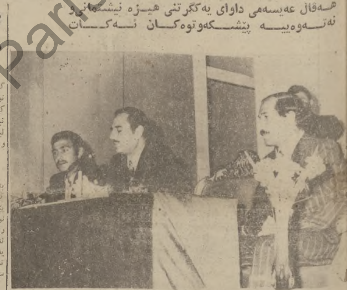
سەر لیسە یانی رۆژی دوو شەمە ی رابوو دۆر رێگەوتی ۳-۱۵ ھەفەل شیلی عەيسەمی ئۆتاریکی سیاسی لە زانکۆی تەکنەلۆجیادا خوێندەووە تیا پیاویدی ئەو دەرە ی کرد کە حزبی بەعسی سوشیالیستی عەرەب لە کۆمەڵگای عەرەب دا گیراویەتی ، ھەفەل عەيسەمی رۆژی

بە یانی ھوای ئیستای سەرچاوانە ، ئەو ھێزە ی ( صاعقە ) لە چوار کە تیبە یێک ھاتووە و فرمانی بێ داوێ رێگای بەرەو پێش چوونی لە شکر عورە ی لوبیان ئەدات و ئەیلێن ئابووی کۆشکی جیھوری بەدەن زۆری لە فرنجە بکەن تا دەست لە کار بکێشێتەووە . رۆژنامە ی ( الشرق ) کە لە بیروت دەر نەچو و سەر بەرێزی شامە نووسێویەتی ئەتی : ھیزە کانی ریزیسی سوریا بۆ دەستیان خستو تە ناو کاروبار و رووداوە کانی لوبیانەووە تاو کە سلیمان فرنجیە سەرۆکی لوبیان ببازرێن . . . نەو ی شایانی باسم پێش ئەو کارە ی سوریا چەند جارێک سەر کردە کانی حزبی فەلانیستی ( کاتب ) بەگری گیرا و کار بە دەستانی رۆژ ناوا دا پکات . بروانە ل - ۷ - باشکۆ