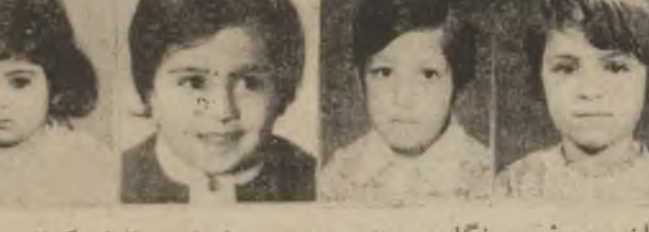
سروه یوتس وهرزیر علی دانا جهرا شادان عمر سوزان روهوف رزگار مجید دهرسیر ابراهیم نایار کمال

چیروکی گوشه • رازی تووو زوی • نویسنی نیراهیم قادر ده کیشی ؟ به گا بلن ! ههرده می گاسن گیشته گا : جووتیار کلینم بز سه زوی ۰۰ زوی هاواری ده خویشتن جیکه شهوم بز لئ بهرزه بوهوه : خوش ده کات ، جلی گهرم - نای گاسن بز سنگم له خوری و موو بز ده چنسی هه لده دی ۰۰ نهی چوون کاری بز نه کهم ؟ به گاسن : به هیش و مزان جووتیار بلن ! بلن بز رام ده کیشن ؟ جووتیار : توو بانگ ده کات هیش و مزان : نه نهی گاینجه له ناو نه باره کانه ووه ، ده لسن : بز به نیله ووه ده مان به سستی ؟ بز به ویشته با سه وزیم ! به نیله بلن ! کاتی توو هات بزلات بز بلن ! نیله : نهی بز گا رام : توو : زوی خوشه ویست ،