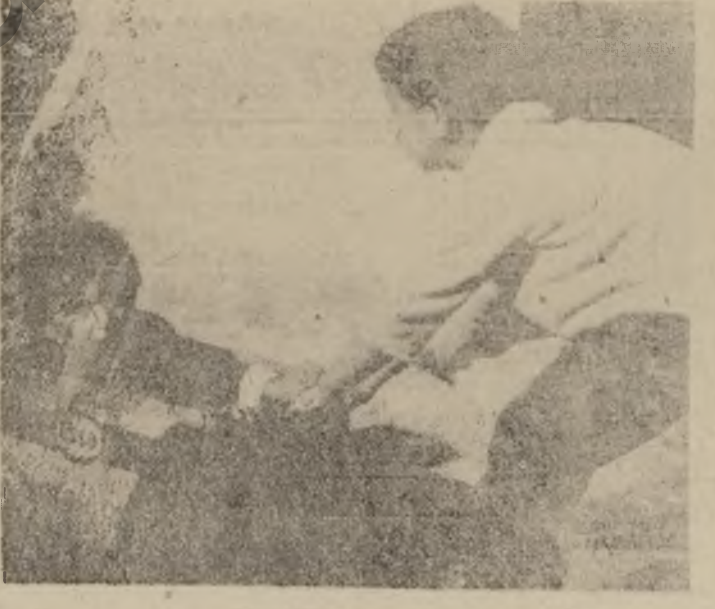
جهانی سینه مایی

هاتوه که له بزوتنه و رزگار لایه یی مرزخانه یی له کیشه یی فهله سستی دا ، که مهسه له یی نیستمانیکی زوت کراوه که لایکی دهره دهره مروزنی بن بهش کراوه له مانی زبانه ، بزو خسته زورانی بازی له خاکی فهله سستی دا له نیوان نه به ستری .