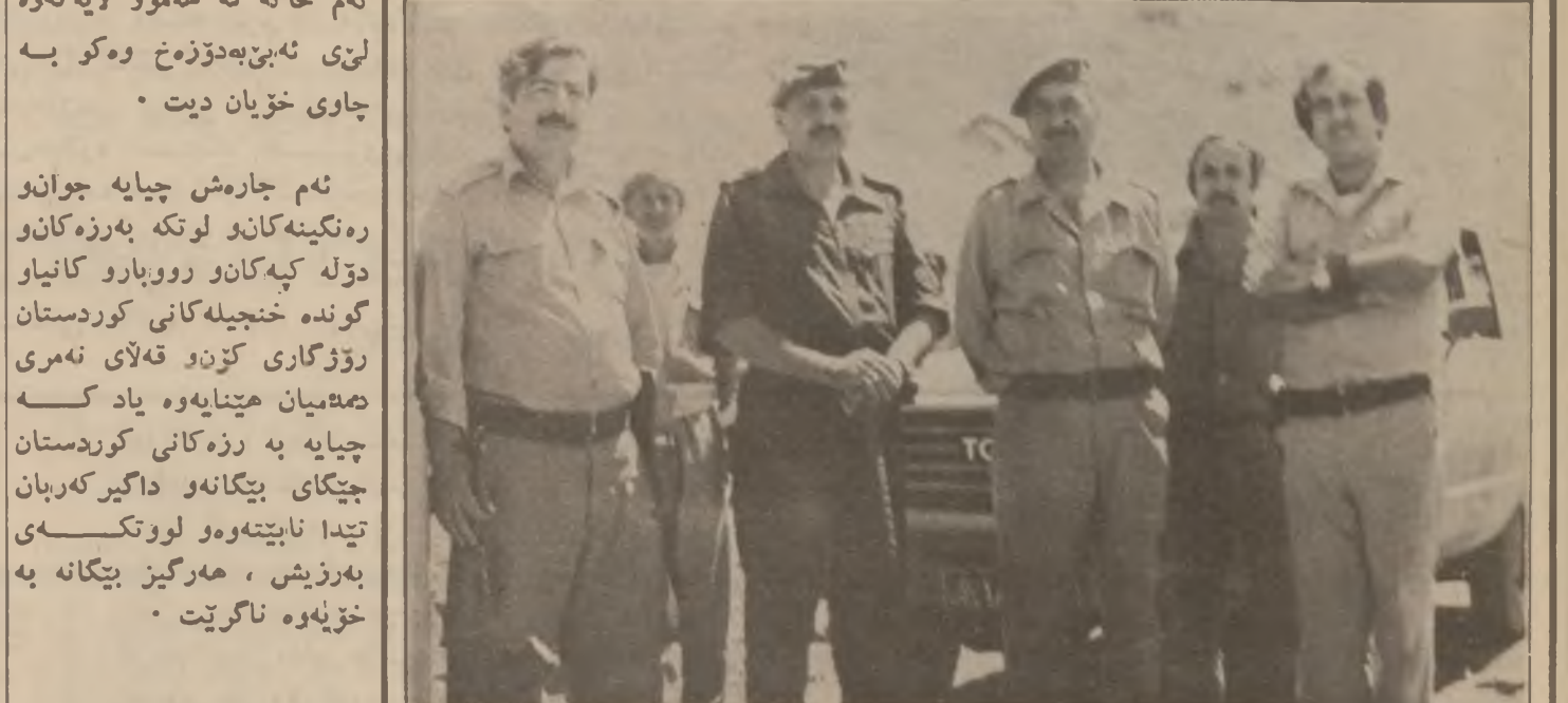
سهراني به ري هاجي ژبه ران

دواي تيك شکاندن هه موته وه هيزشه ناره واياني که له شكري خومه يني بۆ سه ره سه ره مه نده و زرباطيه ي کرد ، به ده ستو بازووي به هيزو به خويي گه شي لاواني عيراق و سوياي قاره مان تيك شکيران ، نه مجاره له باکووري عيراق خۆشه ويست وانه کوردستان ، شاعه باسي سه هويان لسي زيندوو بووه وه به لآم نه مجاره عه مامه يه کي گه ره و گرانسي له سه ره نابوو له جياتي تاجي