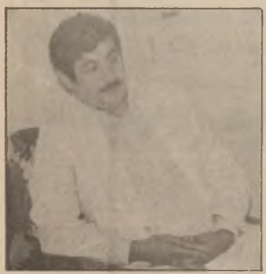
77/22/868 دنياربان زياد کار کردوه .

● له لقي هه وليير مه : دواي س سن سال له جهنگي ره ومان ، بازووي کريکاري کورد به ره وامه له بنيات نان و ناوه داني ، ته قه لاي بر و چان له کاردايه له پيشا و دروست کردني نه خسه ي نه و و لاته گه وريه يه که رۆله به جه ره کانس ماناي ماندوو بوون ، به ناره قه ي شيرين و پته ي پيرۆزي عيراق نازانو خۆگه رو کۆنه وه ده کيشن ، بۆ نه وهي دووياني بکه نه وه ، که نه م وولاته به جه ره گه پايزه گه وانه يک نيه هه لوه دي ، نه م وولاته چۆک نادو ناگه رپتوه ، هه موه کونچ و که له به ريکي ده کاته گۆي دوژنه چاوخه تي که کان ... به ده ستک هه ، هه هه لده گريو ، به ده سه ته پۆلانيه کسي تريش و لاتي «سه لام حسين» ده کيشن .