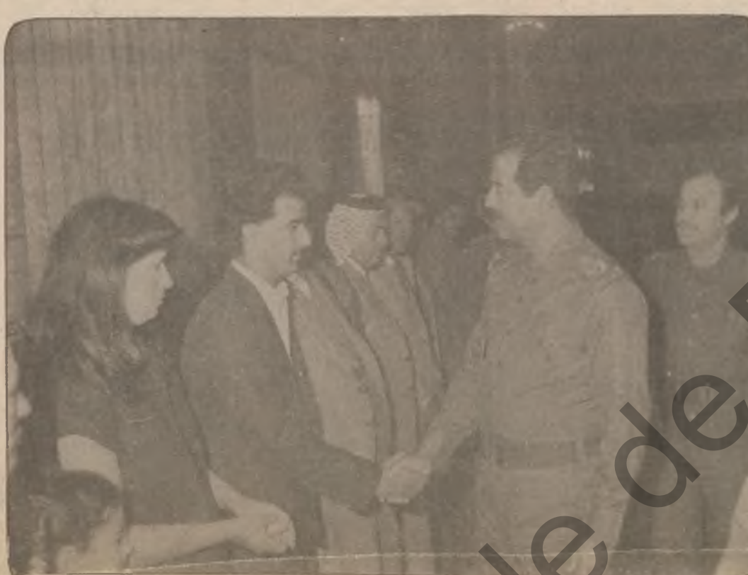
ده تی و نرومان به ره سهره کی فرمانده له لایه ی ۳ دا به

پیکه ده ئیران له نیوان ریکخواری «فتح» دا سه ره کهرتی سوپایی فله سستین ناشکرای کرد که پیکه ده لیزان له نیوان جه نگاهه رانی بزوتنه وه ی نازادینخوازی نیشتمانی فله سستین «فتح» له ناوچه ی بقاعی لوبنان تا شه وه ی چواری نهم مانگه و بۆ روژی دووم ههره یه . په نجه ی بۆ نه وه کیشیا که نهوانی له بزوتنه وه ی «فتح» سه ریجیان کرد وه وه له لایان روژی سووریاره پشتیان ده گه ری ده یانه وه ی گه مارۆی شوینی نه وه پیشمه رگانه ی بزوتنه وه ی (فتح) بدن که سه ره به یاسر عه ره قاتو له نزیک شاری به عه له یگی لوبنه وه ن .