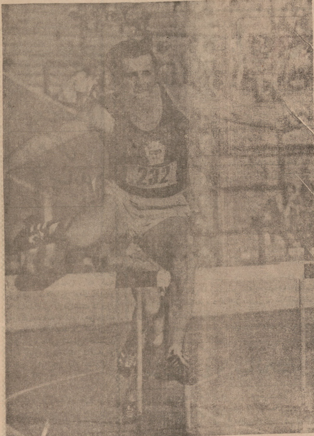
لایکی چیکوسلواکی هیرسولاف گودیش بههوی چلاکی وزیرهکی و بهکارهینانی نهخشهی...