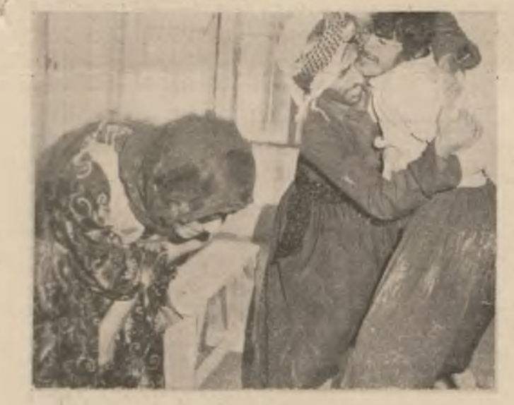
دانهزانی ۹۶ باشماوه

۷ - له کاتیک کاناوه ههول قوتابیانیش لهسر روی تابت و خوت تانی بکههوه تارادی پیش گهوتنت دیر هرهنگری .