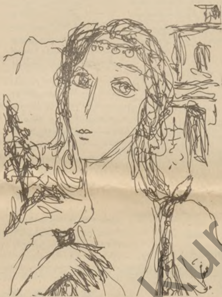
نه بو به گو قهره داغی