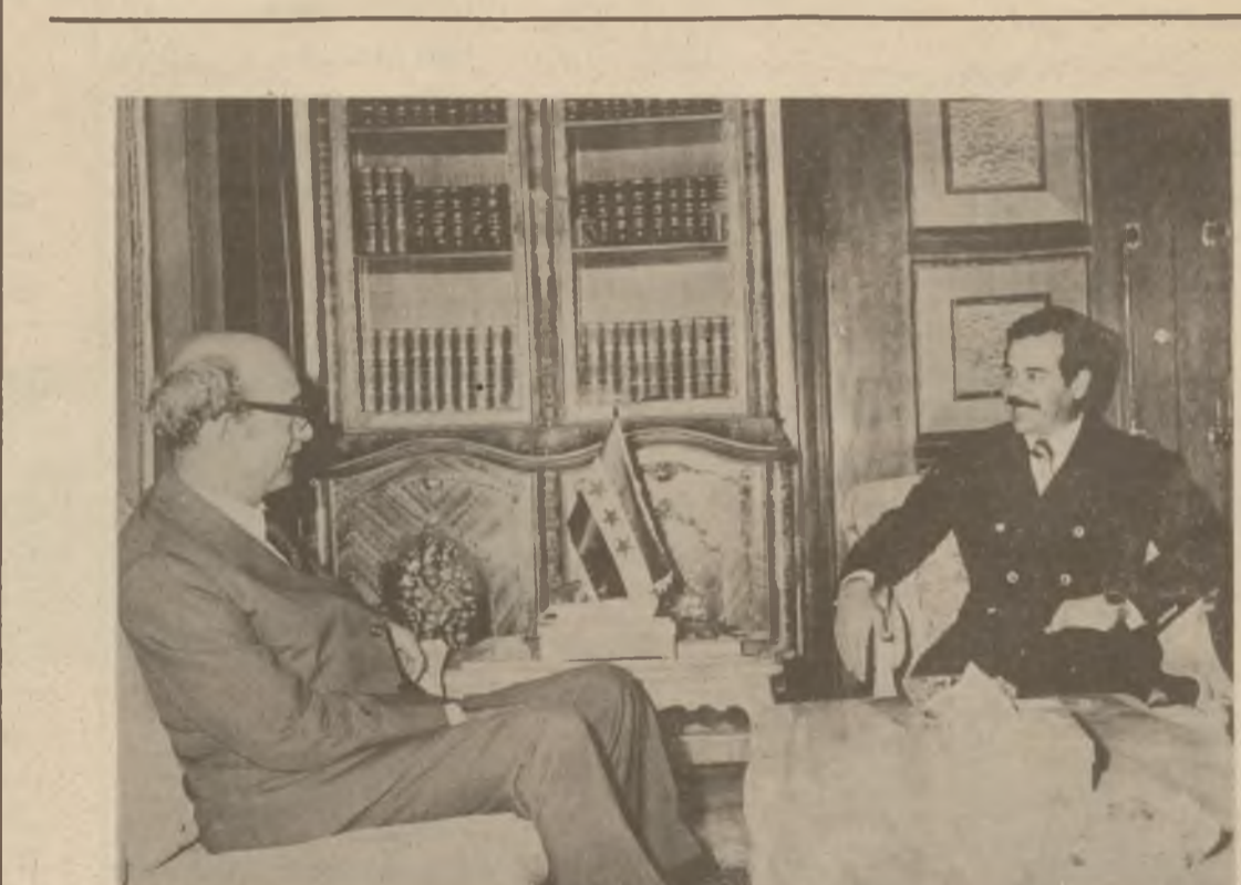
سەرۆکی فەرماندە بێناکردنی سوشیالیزم و رەفتارکردنی دیموکراتیەت ئەو پێویست دەکا گەتیکۆشان لە پیناوی لە ناوبردنی نەخویندە واریدا گەر مەتر بکری