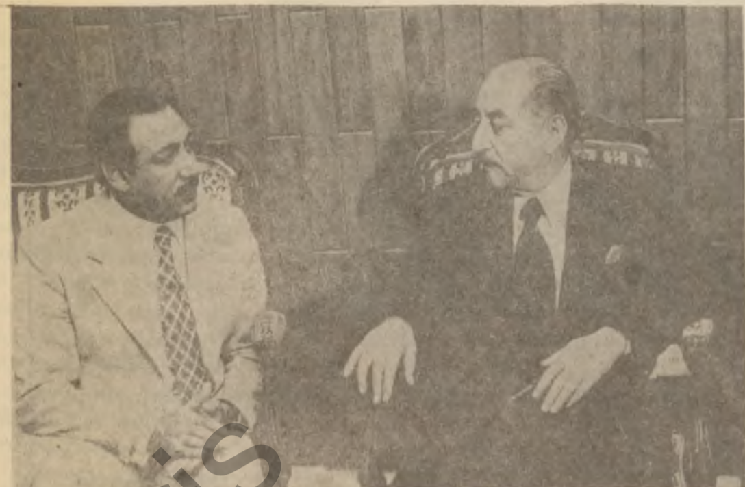
سەرۆکی فەرماندە بێناکردنی سوشیالیزم و رەفتارکردنی دیموکراتیەت ئەو پێویست دەکا گەتیکۆشان لە پیناوی لە ناوبردنی نەخویندە واریدا گەر مەتر بکری