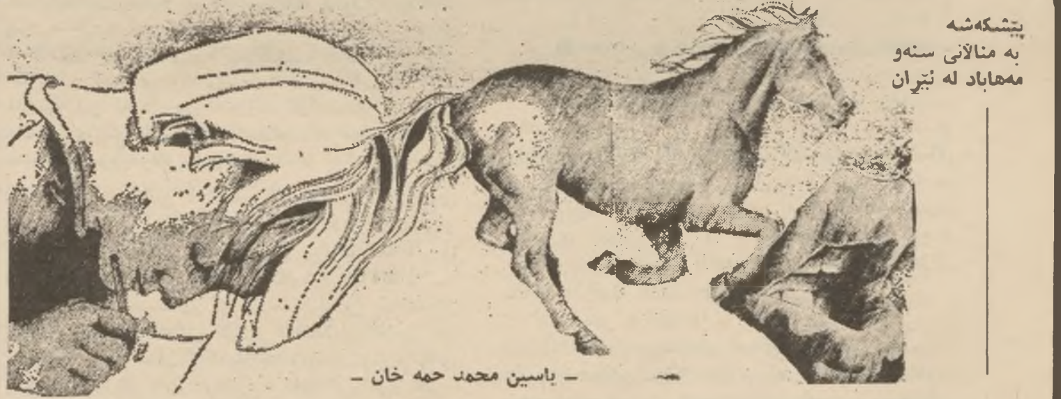
بیشکهش به منالانی سنه و مه هاباد له ئیران

له پاوه داو له زمینه ی فیداکاری به کسی به گه ردا چمنده ها خمیان سه زکرد نه و نرگول خرنجه بان هه له وهران ... به بی تاوان میتشکی لاوانیان ده بژان !! چلکاو خۆره بچ ره حه کان به بارووت و زری پۆش و موهله سله ناگراوی وشه ی مافد بان له ده ورونی شو رشگیرانا ، کپ ده کرد ... به لام خه لکی پاوه ی پیروژ زیاتر ترسو شالوای مه رگو و نه مانیان بۆ تا قمی دار ده ست ده برد !! حوکمی بۆ گه نی تارایش تا بیست زیاتر له ناو بوته ی مه رگی خوی دا ده کولیتو پرووه هه ل دترو زه نویر ده جیت تا روژی دئ شو رشگیران ده سه لانی چه وساره بان به ده ست ده بیت ... !! - محمد کساس -