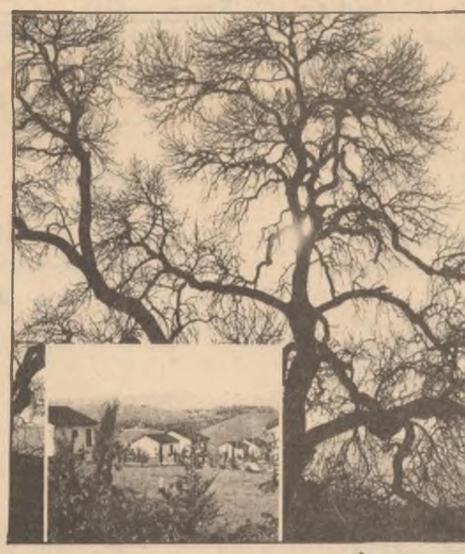
سایمانی و روزنه

هوا یی وهزی گه رمایه .. کوردستانی دنگیرو خوشی نیمه ش ، به سهدان شوینی حهوانه وه هوا یی به هوا یی تیا به .. باخچه گه شاره و رازاوه کانی سینه یی بهر که پیرو سابانه کانی ، به هه شتی جوانی سه ره زمین لهوه یی هاویندا باوه شی کردنه وه ، به شنه ی شهمالو کانی سازی گاری گنایوه سرو شتی کانی دیمه یی دنگی دلسی هه زاران نهکانه وه .. ● له چاوپیکه وتنه کی خیرادا بهر پیز بهر پیز بهری نوسینگه ی گهشت و گوزار له سلیمان .. کاک عمر علی جیب یاسی بهرنامه ی گهشت و روشتی خویانی پس کردین که نهسان جیاوازی هه به له چاو سالانی تر دا ووتی :- - نیمه جکه لهوه ی نوسینگه که مان هه لته سنج به دابین کردن و ناماده کردنی شوینی حهوانه وه ، بۆ نهوه که سانه ی گهشت و سهیران نه که ن ، که لیره وه به دلناییه وه خوی و مال و مندا ل و نهوه که سانه ی نه یان وئ به شداری گهشت که بن ، بهر وه نهوه شوینه نهکونه دق ، به بیته نهوه ی دلخواه کی نهوه یان بیت ، جیکابان بهر نهکوه ییت یان جیکه نه دوزنه وه . به هه ش نه ریکمان له سر هاو لاتیان کم کردنه وه .. سه رهاری نهوه ش نوسینگه که مان له بهرنامه ی تابه ی خوی .. چه ند پروژه به کی بهرنامه گهشتی به کومله ی به ده ستر وه به .. که تیا پدا سهردانی هاوینه ههواره کان و شوینه دزیرین و جیماوه کانیسی کوردستان نهوه ، که به نرخیکه هه زان نیمه گهشتانه بهر پیز نه چیت . ● ناشکر ایه له چهنه کاند گهشت و سهیران گهران زور تره وه له سه پروژه ناسایه کانی تر ، نیمه بۆ نیمه بۆ نه به هیچنان ناماده نه که دوه ..