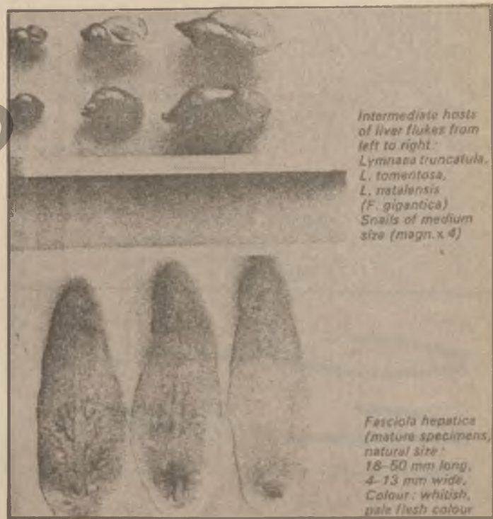
Intermediate hosts of liver flukes from left to right: Lymnaea truncatula , L. tomentosa , L. stagnalis ( F. gigantica ) Snails of medium size (magn. x 4) Fasciola hepatica (mature specimens, natural size) 18-50 mm long, 4-13 mm wide. Colour: whitish, pale flesh colour

الفشاء المخاطی) بیت لهشی دئی بیته بن . ۳ - تهرشن توشی فی گرمی بسی دئی بهتیز و لاوازبتن نو هندهک جارا دئی حهسهربتن . نو چلتیت شیرری دئی شیرری وان کیم بتن ههروهسا گرانی لهشی وان زی دئی کیمبتن . ل کهل کولتیا میلانک نو زرافا وان چتلا . ۱ - نهو بهزی توشی فی گرمی بتن دئی هر بیبا وان زفریتن نو کهلهک بساناھی مروف دئی زئی مهکتن نوسو بهرئ هیرین نو کولتیا کیمبتن . نو دیره ژ نیشکهکئ نهو بهز مرارتن . نهوه مروف ل سهر توشی هلدبتن گامفا پیایا ناژول ل بن مایکرو-سکوپن ههحص کنن دئی هیکیته گرمی میلانکی دبارن . ههروهسا نهو بهز نو جهلیت ب فی گرمی مراردین دئی فان گرما دناف میلانکو زرافاسا وان دا بیتن . یو پاریزتن و جارهسهرکنا تهرشو تهوالی ژ گرمی میلانکی نهوه . ۱ - نابتن خودان کهریت تهرشو تهوالی... بهسز و جهلیت خول جهیت بیس ب چهرین نهخاسه نهو جهیت ناف لئ د بهکتن چونکه کههک دمی شش حهتا ههشت حهتیا بیتن ناف میلانکی دا زهری بچتن زرافانی دا... نو دئی دمی دا بهرهقه مهن دین نو دینه گرمی بالق نو هیکادکن نو دچته دناف ریگیته کهدا نو ل گهل بیاتن دهردهکتن نو هوسا جارهگادی دهورا ژباناخو زفریتن نهو نو بارانا نهوه (ده-۱۲) هه یفا نهکشتن ژ چونسا بهرهقی نو ناف لهشی حهتا هیک دهردهکتن . نو نهف گرمیت هه بو دمی سالهکئ دژین و هندهک کهلهک سالالا دژین . نو ژ نیشانیت نساژول نهویت توشی فی گرمی دین نهفنه . ۱ - هندهک کرک ل ناف چافا نو ل بن نهزینگیئ نهوهو... نهوهو سپتلاک چافئ دئی شینگی نهگریی بتن . ۲ - دئی کیم خونسای نهانیمه جیل و بهزیته نساخ کرتن نو زهر قسئ