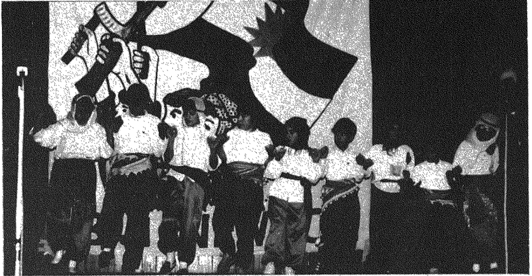
GELECEĞİN UMUDU ÇOCUKLARIMIZ BREMEN NEWROZUNDA

Süreci değerlendirmemiz, bu süreçte TSK olarak, yapmak istediklerimiz ve attığımız adımlar