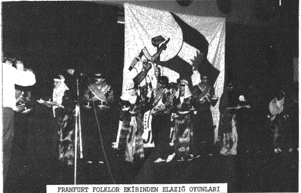
FRANKFURT FOLKLOR EKİBİNDEN ELAZIĞ OYUNLARI