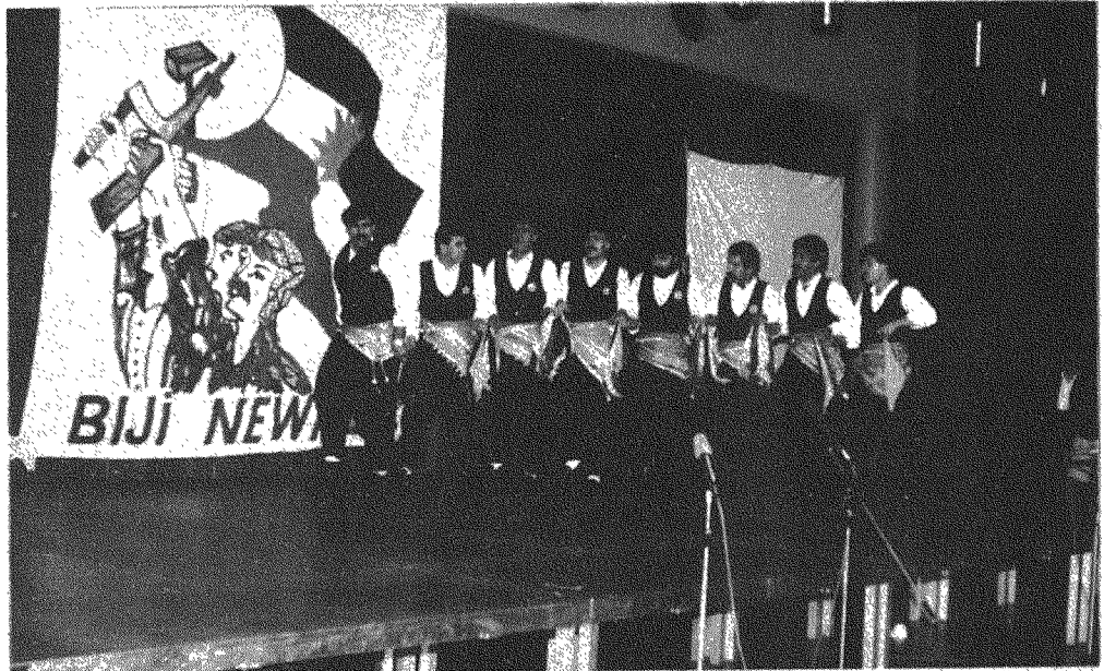
BREMEN FOLKLOR EKİBİNDEN BİNGÖL OYUNLARI