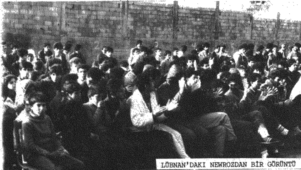
LÜBNAN'DAKİ NEWROZDAN BİR GÖRÜNTÜ

Program, Koro'nun ey newroz marşını söylemesiyle açıldı. Saygı duruşu ve ardından TSK Avrupa komitesi adına bir yoldaşın yaptığı konuşmayla sürdürüldü. Konuşmada, yaşadığımız sürecin önemi, mücadelenin gelişim seyri, TSK olarak bu süreçte nasıl müdahale etmek istediğimiz ve bu doğrultuda