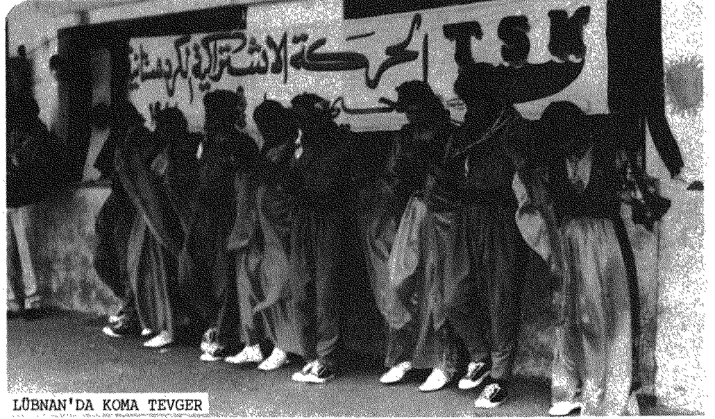
LÜBNAN'DA KOMA TEVGER

Ayrıca değişik yerlerde ateşler yakıldı; Newroz ateşi silahların ateşleriyle birleşerek yankılandı.