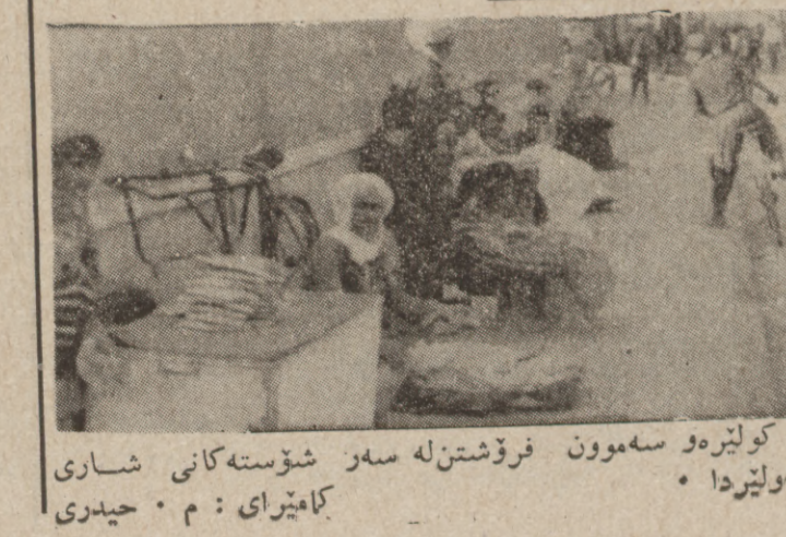
کولپره و سمون فروشتن له سهر شوسته کانی شاری هه ولیردا .