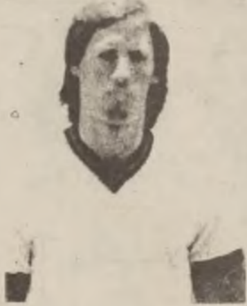
سیتی» وەکو یاریزانیک، بەلام له ژیر دیزیدا.

له (۷) تشرینی دووهمی ساڵی ۱۹۶۱دا، مارک هایتل له نیوان خیزانیک وەرزشهواندا له دایک بو، پاوکی «تۆب» یاریانیک هۆبە ی له نیوان تیبی دا گەوره بوو هاندانی باکشی له سەر هەمووه که دەیهویست بپیتە هیش بەر ئیٹا سەرکەوتی ئهوشتانه بچن بهینێ که خۆی نەیتوانیوه بە دەستی بهینێ. له تەمەنی شازدە سالاندا پراهنی یانە «ئوتنگهام فۆرست» ئیستا، «براین کلاف» بینی نۆز پێخوشحال بوو دووا رۆژیک بۆ دەبیینی له جیهانی تۆب دا. له کۆتایی ساڵی ۱۹۷۸ دا مارک هایتل جووه یانە «کۆفنتری»