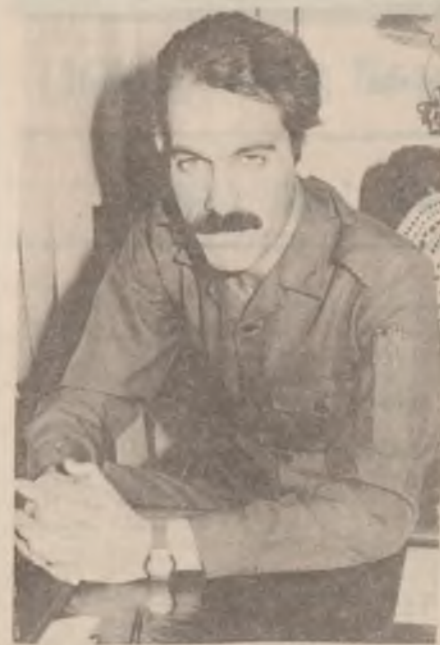
لقی هەولێر -

بەریز ماموستا [ابراھیم چنگەنە] پارێزگاری هەولێر بەبۆنەى روژی شهیدەوه بۆ «ھاوکاری» داوا وێتی: گەلەگەمان بەتێگرا یادى ئو روژی لەبەر ناچیتەوه که روژی رەگەز پەستی ئێران هەلسا بە کوشتنى ژمارەیک لە بەدیل گەلەگەمان، بەم رەفتارە نامۆقائەتیەى دووھاتی ئوێ هەولێر، بەرنامەیکى تێو تەسەلى ئامادەکرد... که بریتی بوو لە پێشانگاو کۆبو سەردانى خێزانى شهیدو وون بووگان و چەندان چالاکی تر... بەم بۆنەوهش پەیمانى وهفادارى دووپات دەرکەوتەوه بۆ ھاوکاری خەباتگێر [صدام حسین] که هەمیشە سەربازى بەوفا بێن بۆ پاراستنى نیشتمان و لەسەر ئێى ئو کەسانە بڕوین که خۆیان کردە قوربانى بۆ سەربەرزى ئو عێراقە ئازىزە.