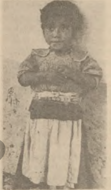
منالیک له مه کسک ، به کامترای جیزیل