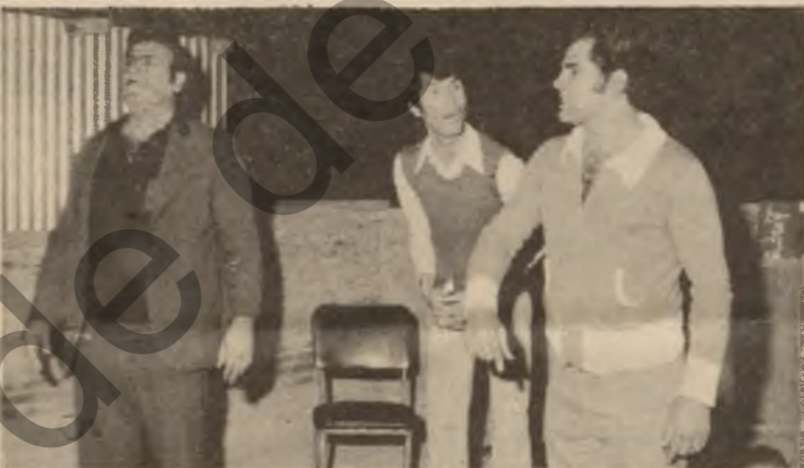
په کیتی قوتابیان ، لقی مهولیز ، لم ماوه بهدا... چندها کوری فراوانی...