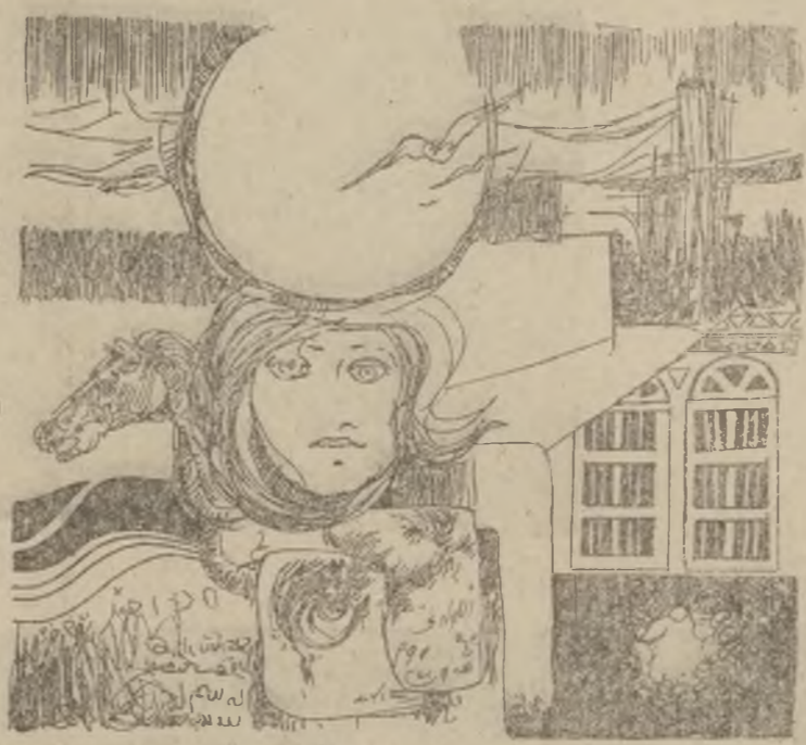
نمودار قادر محمد