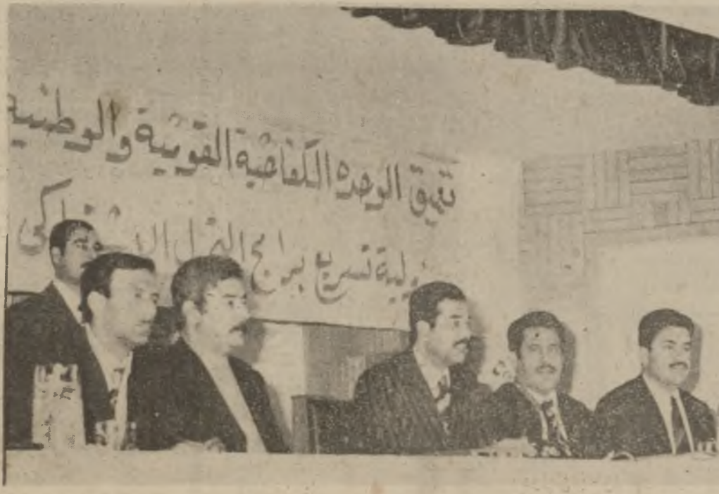
ما مۆس با عه ده ده ست صدام حسین له کۆ بو نه وه ی یه کیتی گه لی کریکاراندا :

ده ر ئه به یین ! روژی ۲۵-۲۴ خویشاندانیکی گه وه ی چه ماره یی له شاری نیکۆسیای قیبرس ریکخرا بۆ ناره زایی ده ربیرین دژی ئەو سیاسه ته ی حکومه تی به ریتانی سه پاره ت به کتیسه ی دوو رگه ی قیبرس کۆتیه به یه ر * • دوازه وه زیری تر دا یترۆ وه زاره ته که له ۱۸ وه هیزه پیک بیت شه شیان سه ر به هیزه نیشتمانی به کان بۆ شه شی تریان سه ره به راست ره وان بیتی یاخود وه زاره ته که له شه ه وه زیره وه پکرئ به ( ۲۴ ) وه زیرو نو ئیهری هه موو لایه کانی ئیادا بیتی *