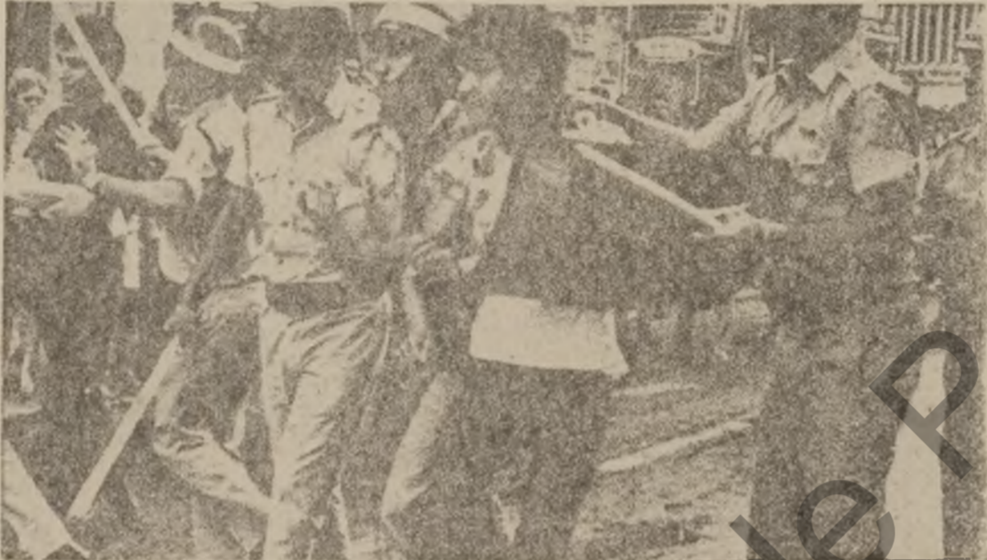
ههوهو شتني زاپونيسته كان بؤگوشتن و برنيسه سروشتي ره گه زهزبهستانه ي خزي سماغ نهگات هوه ۰