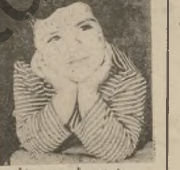
به ری حاجی عه لی -