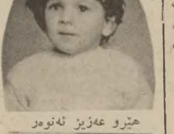
هترو عه زیز نه نوهر