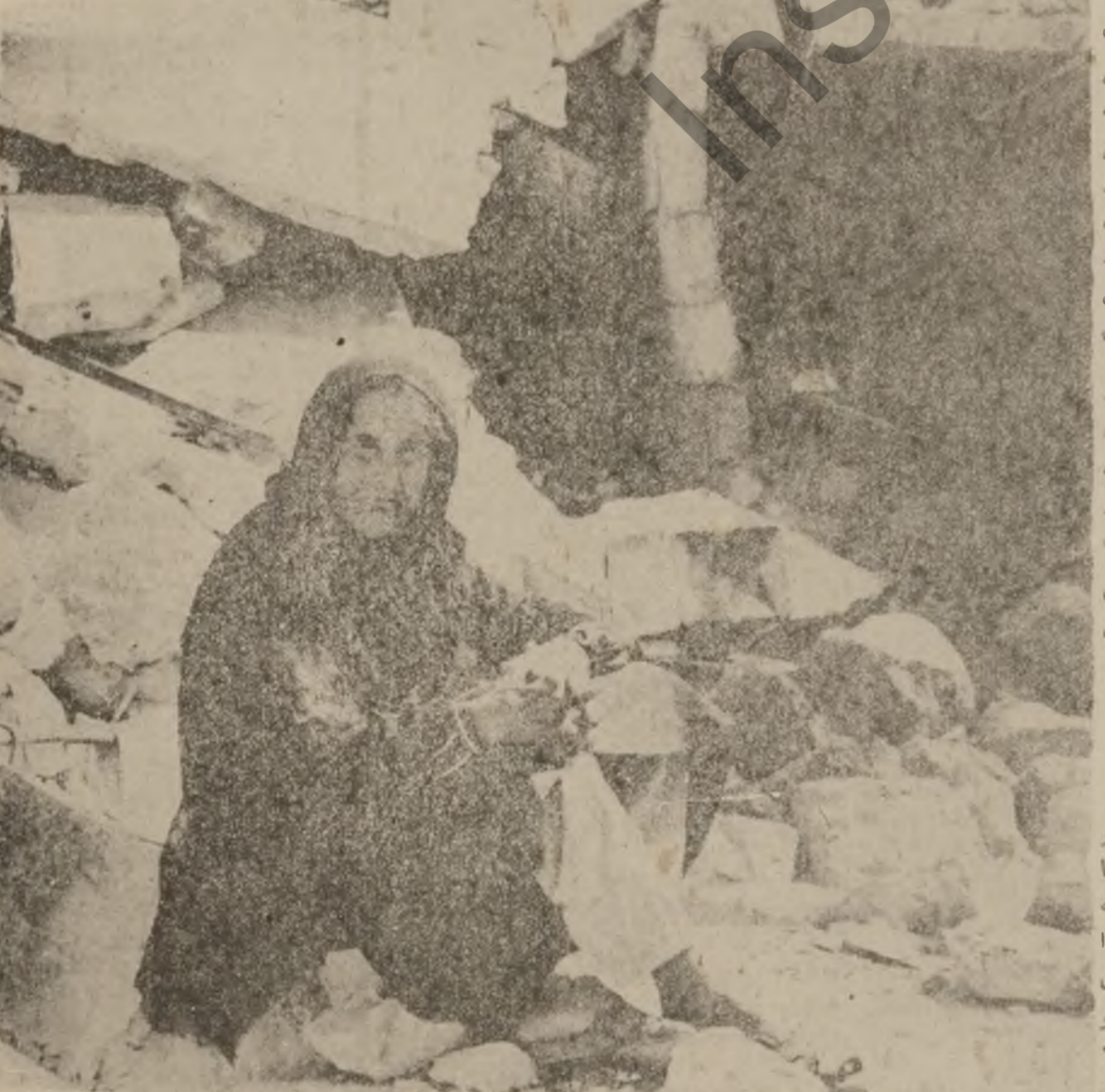
قهواري زاپونيسته كان له سهسهز بهر دهتي و ترانكاري تاواني به م جزوه دروست بووه ۰

نهگات ۰۰۰ له گهل پروانه مانيش دا توندو تيزي دينه كابهوه ۰۰۰ نههش ورده ورده بهر سو كالاي تاوان نهگات بهر خزي ۰ كهوتوه و شو له نهل خزي دا