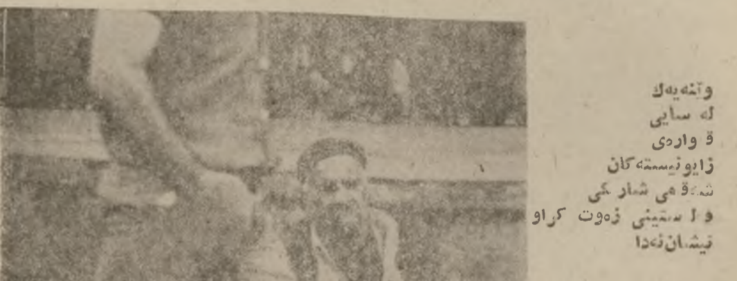
وتنههك له ساينې ه واري زاپونيسته كان نهوهي شماري و استيني زهوت كراو نیشان نهدا

تاوانباري چهكار : سلژه هيل و تويه ، نهوهي زياتر ناره حهتي كردوين نهوه به كه تاوانباران چهك و تفاسي شهريان ههيو له بهر دهست دابه ۰۰۰ نهو چهكانهش ده مانچه وه شستيري نارنجك و چهكي ريزه جايان دزين نايه ياخو له شهردا ده ستيان كهوتوه ۰۰۰ هانارتس له ژماره ي روژي