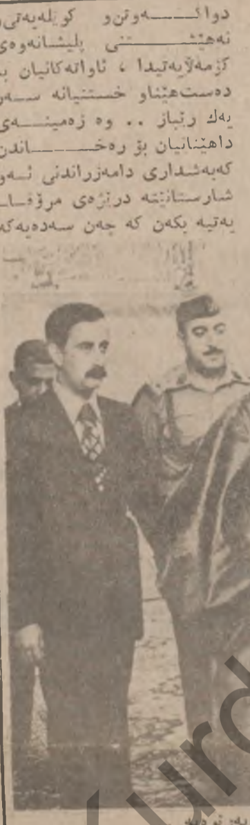
دوائسہوترو کولہیتی و نہ ہیشہتتی بلیشانہوہی کڑہ لایہ تیدا ، ناوانہ کانیاں بہ دوست ہیناوستیانہ سہر بہک رتیاز .. وہ زہینہی داہینایان بڑ رختانندن کہ ہیشداری دامہ زراوہ تی سہر شارستانہ درڑی مرؤسہ بہتہ بکن کہ چمن سہدہ بہ کہ

سہرؤک البکر سہری لہ شوینہ پیروژہ کان داوہ سہرؤک البکر سہری لہ شوینہ پیروژہ کان داوہ سہرؤک البکر سہری لہ شوینہ پیروژہ کان داوہ سہرؤک البکر سہری لہ شوینہ پیروژہ کان داوہ سہرؤک البکر سہری لہ شوینہ پیروژہ کان داوہ