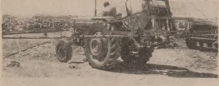
دهرمانني قلاچوگردي کوتي مه کينه کان مه سله اي چاندي بهم جوره باس کرد