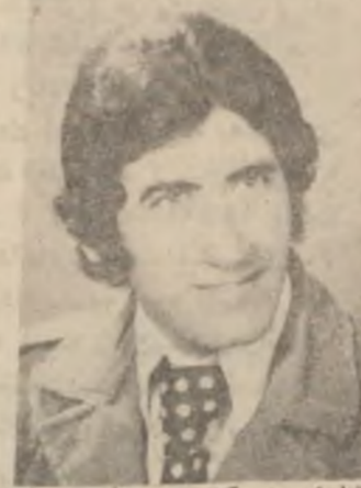
پښتو ژبې د کورنیو شاعرانو په نوملړ کې