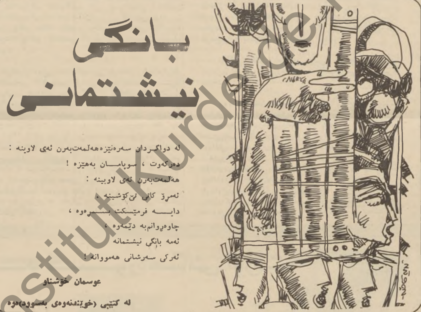
له‌ گیتی (خۆنه‌هوی به‌سووره‌ وه)

هه‌که‌ دین سیاسه‌ت بیت ، دین حه‌له‌نه ... فندو فیلن « به‌زمانێ خۆمه‌ینی » قیچاق ل نه‌هات ئه‌ی خۆمه‌ینی ... !! سلکیته‌ ته‌ ، ده‌وه‌و فیه‌هانت ته‌ ، زبی ده‌رکه‌فتن به‌شتی که‌فتنه‌ به‌ر کویزان و خه‌نجه‌ریته‌ په‌ختا مه‌ ، به‌شتی هه‌ینه‌ ده‌ر ز ب‌ عه‌باکوه‌دین په‌یت ته‌ .... راسته نه‌ا نه‌فه‌ به‌ دیسن .... نه‌فه‌یه ... !! قیچا هه‌سه ب‌زیت ده‌ستخ هه‌زارا قاتابن ده‌ست ، به‌رن نه‌فشی به‌دتیسو خوینم ز ، ب‌ریسه‌ته‌سه‌تی ب‌باوه‌راو نیمه‌ریالیزما جیهانی .... ب‌ریسه‌ت زۆرداری به‌ریته‌ .. به‌ریته‌ . ماهر عبدالرحمن ده‌وک