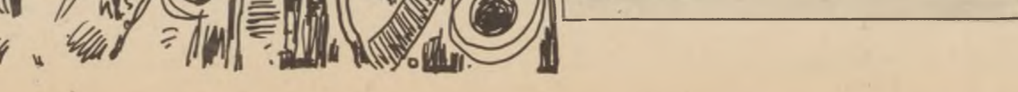
بروئیکه‌ ، بۆ کۆریه‌کان له‌ شیراز

ئه‌وان به‌ هه‌موو عه‌قلیه‌تیکێ خۆپانه‌وه ، تا ئیستا وایان- زانیه‌ که‌ به‌ ده‌سه‌ده‌ری و سیداره‌و زیندان و ته‌هه‌ل‌دان ، ده‌نگی راستی و پاخی بوونی گه‌لانی ئیران کپه‌که‌سه‌ن و به‌و سیمایه‌ کیشه‌ درۆزیه‌وه‌ له‌ هه‌ل‌خه‌له‌ تاندنیان به‌رده‌وام ده‌بن و به‌ حوکمی زۆرداری کۆش به‌ گه‌لانه‌وه‌ دادیتن بۆ نه‌وه‌ی له‌سه‌ر حسابی خۆینو گیانی رۆکه‌ کانیانه‌وه خۆیان به‌ کورسه‌ کانیانه‌وه‌ بگرن و به‌ره‌ به‌ خونه‌- چه‌به‌له‌ کانیانه‌وه‌ به‌دن ، وه‌گه‌ نه‌زانین ، عومری سه‌کی هه‌ر چل رۆژه‌ لوه‌مان محمەد