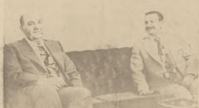
ناوبراوی باسی ٹوہوہی داگیر کراوہ کان و داہین کردنی نہی کرد کہ لہسنی سہلہوہی نیشتمانیہ کانی کسہل بڑ پاراستنی تہقلہوہستاندن لہو دورہی ہدایا پینجہمہ . سروکی ٹیستا کسہ محمد داویش و تاریکی خوتنہوہوہ بہتوندی داوای کرد کہ قوارہی زایونی و ریژیسی خواروی ٹیستا کسہ ہوہ سہلہوہی کارہی دا ٹیک ہنژدرا .

کولومبو - نا. د. ع. ۶ - پیرنی ٹیواری کونفرانسی پینجہمی سروکار و حکومتہ کانی ولاتہ بی لایہ نہ کان دستتی بہ کار کردہوہ . لہ و کزبونہوہ ہداسہرہ ک و ہزیرانی سری لانکا خاتو سریمافو باندرانیکا بہ سروکی کونفرانسی پینجہم ہلنژدرا بڑ تہم دورہی ٹیستا کسہ سن سال دورہی ہون . یاد دہوہی راہہ ہنرا کہ باندرانیکا ہلنژدراوہ چوہ اسراہہ کونفرانسی کونفرانسی لہ سروکی دورہی پیشو و لہ سروکی جہاز ہواوی ہومیدین و ہرگرت . پاشان ہومیدین لہ و تاریکی درژدا باسی ٹوہی کرد کہ ہنزی بزوتنہوہی بی لایہ نہی و لہ چہنیشینی بیوہدی کونی ناو دولہتان چون بہرہی سہلہوہ .