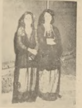
شلیزو هوما کاک فیریدون دارتاش