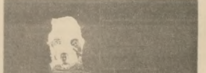
ئه شهکوهتی سهرارود