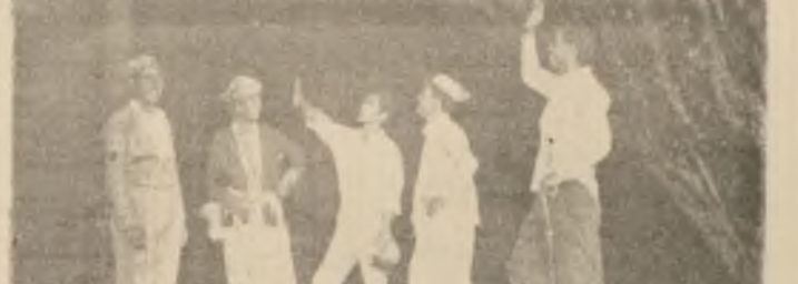
ئه شهکوهتی ماران