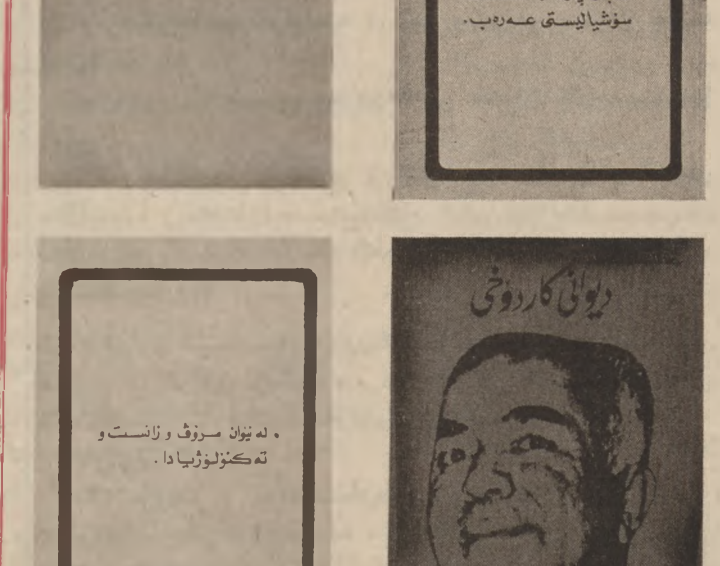
سه ن چاپكار وى رۆشن بى رى

سه لوى خۆشه يه ستى بۆ ئه مو جگه ر گۆشه خۆشه ويستانه ي ، به خۆشه يه ستى مامه لى مان له گه ل رضه گه جوانه كاندا كرديو •