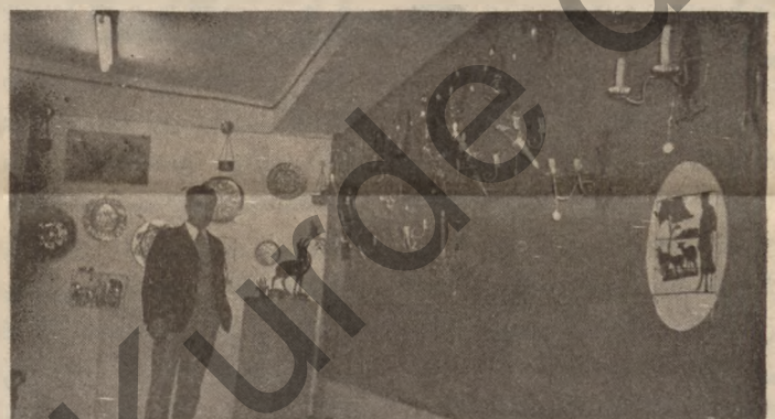
مهلبه نده كه مان ، چونكه لسه سالا ئى رابوردوودا ماوه تى ده ورانه ي ده كرانه وه له يه ك به شدا سه م مانگى ئه خاياندا ، به لام ئىستا له يه ك به شدا ته نها ماوه ي يه ك مانگ ده مينى ته وه ، يه كومان ئه م نه كارى كردو ته سه ر هه موو رو يه كى به ره مى پيشانگاکمان

نه ره شايانى باسه له به شاندا به ره مى ورده كارى سه ر نه و را كيشيان به شه شتويه كى سه ر كه وتوانه پيشان داوه ، به لام به سه به را و رديك له چا و به ره مى سالا ئى پيشوودا ، به تايه تى به ره مى سالى پار ههست