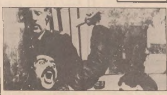
به کتیک له و هاوولاتیه ئیرانیانیه که به لاماری بالیۆزخانه ی رژی می خومه بنی یان دا له شه ری لاهی .

گۆفاره که له و ژماره ییدا که ۹۶ لاپه به ی بۆ شه ری عراق و ئیران ته رخان کردوه وه به دورو دریزی له لاینه سوپایی هه نه ری به کانی کۆلیوه ته وه ده لی ئه نجه م کانی هاو نیسی ۱۹۸۴ ئه وه یان ئیسات کرد که عراق ده وانی ئابووری ئیران بخنیکن .