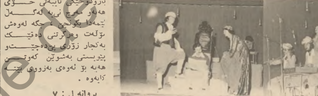
بروايه ل : ٧

له كاتى پرژده تى بانويسن كومه لىك فوتابى له كاتىكى دبى راي كراودا كۆ به كين هوه و كاره كمان رابيه تين هه ره بهر هه شتى كه نخشى بهر هه مى شتو كى كه نخشى لىش كرنى بؤ داننه ريت له نمانه سهرناگرئ تمانه ت بهر هه مى فستقاله كانسى زانكوش زور بهرزه حصه ت دته كاوه .