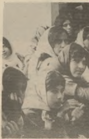
تهنگو چهلمهى ئيشوكاربان...