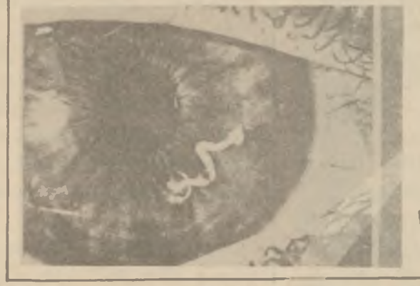
روهک لهناو چاودا

همه وازانراوه بهلام بهی ووهک زانراوه چاوی ناده میزاد یان نازول شوئیکتی گه لجه بهاره بسو روانی روهک به شتو به کی ناسایی ، یانی توری روهک کیکت خسته چاویکته ووه ، ده شتی بسوری و سوزین !