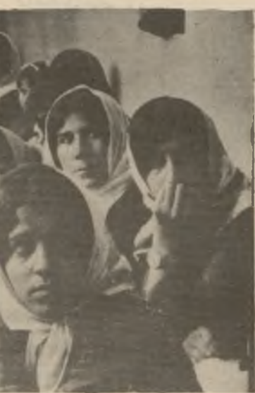
خهلاتيان ائه كه...

چالاكى به كانى به كهيتمان بلاو بكه بنهوه .