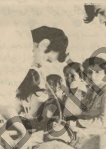
بؤ نهوهی ئيمه...