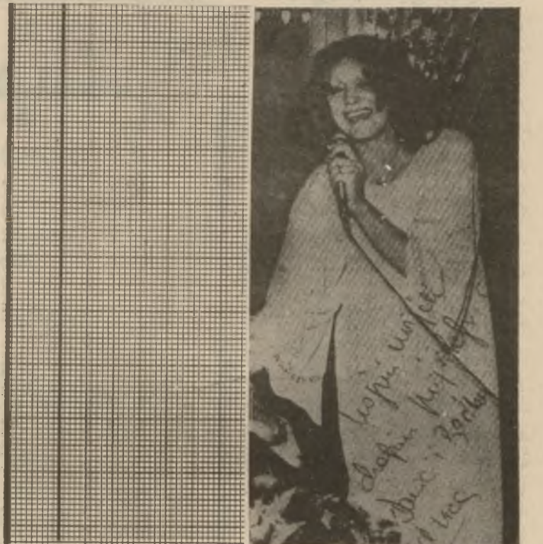
بهدله دهلى : گهله...