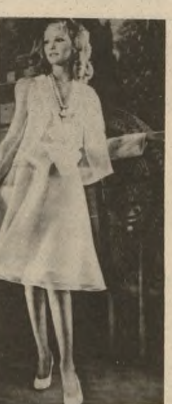
كراسى سبى دالين . له گهله چاكهتى تمك و...